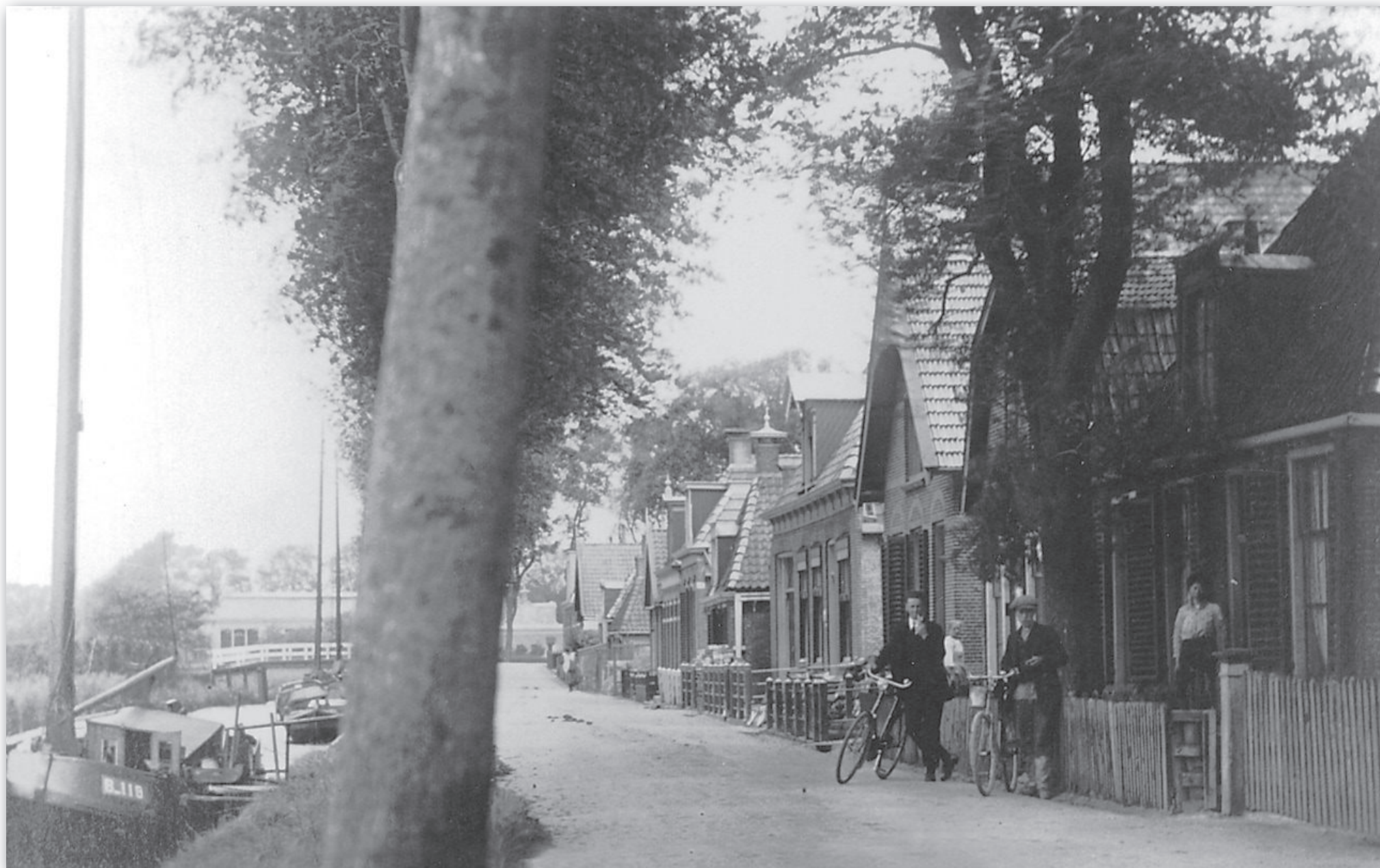
Tel de gevels van rechts naar links! In huis no. 6 woont de familie Lont

kamer binnen. De oppervlakte van de kamer is 7,4 m 2 . Nogmaals: de oppervlakte van de kamer is 7,4 m 2 . De Knepelsteeg strijkt met de droefste eer. Wij staan hier voor het kleinste huisje van de vierhoek, zeker het kleinste onderkomen van St.-Annaparochie en misschien wel van het hele Bildt! We bukken om door het gammele deurtje binnen te gaan. De hoogte of beter gezegd de afstand tussen de vloer en de zolder is 1,90 meter. De vloer is gemaakt van stenen en ligt op de zelfde hoogte als de buitengrond. Is het buiten nat, dan is het binnen nat.