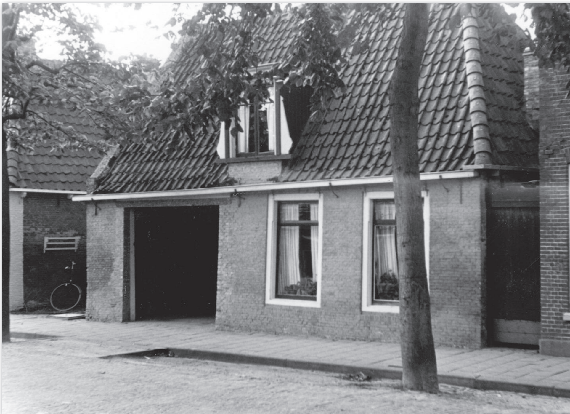
Warmoesstraat 10 met de garage van Sipma en links de Noordersteeg

Klaas Gerrijts Elsinga werd in 1734 geboren en was getrouwd met Renou Feikes. Hij was schoenmaker. Het echtpaar kreeg ten minste