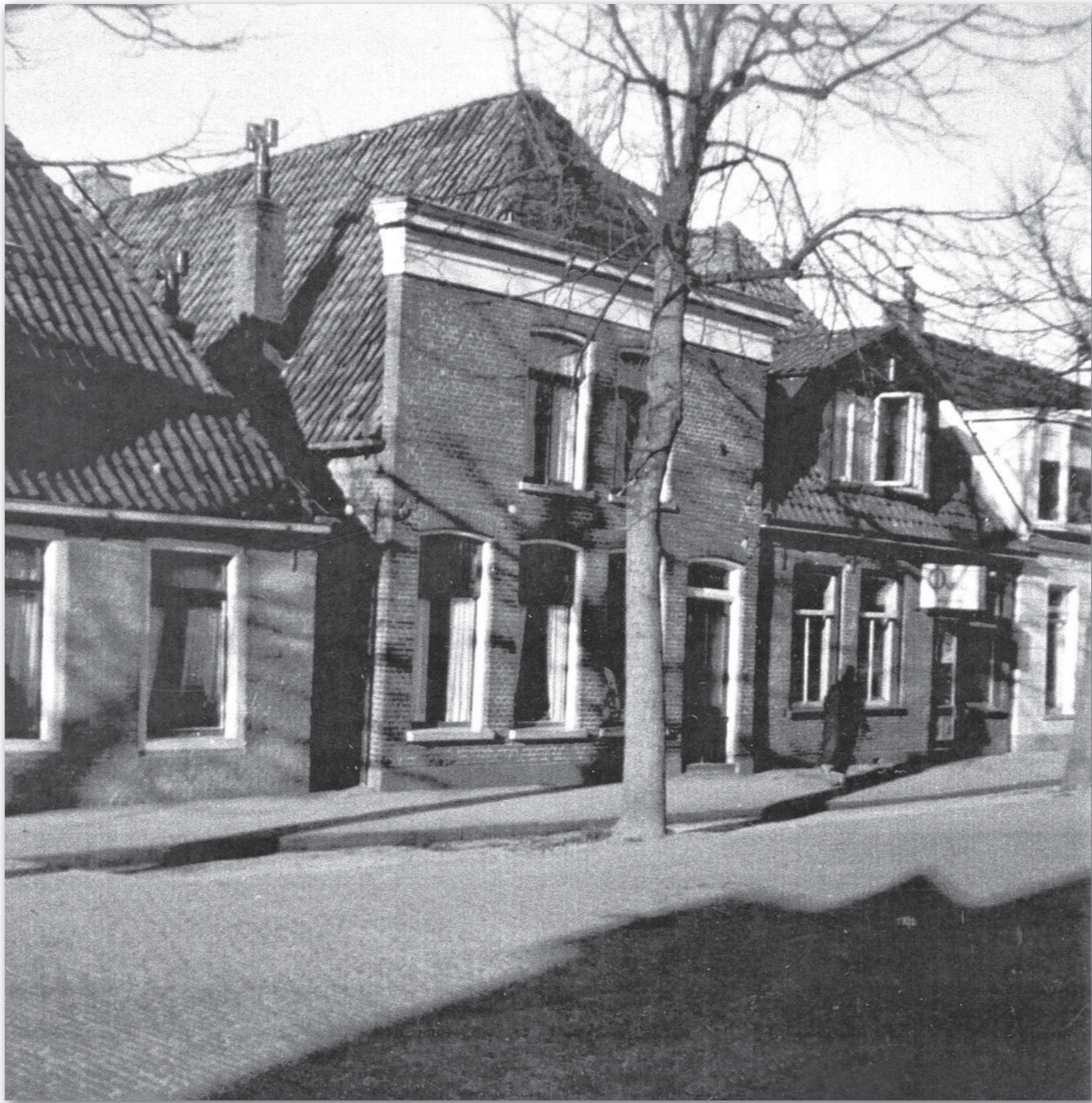
Het huis met de imposante kroonlijstgevel voor 1962 toen het huis werd voorzien van een zadeldak met wolfseinde.