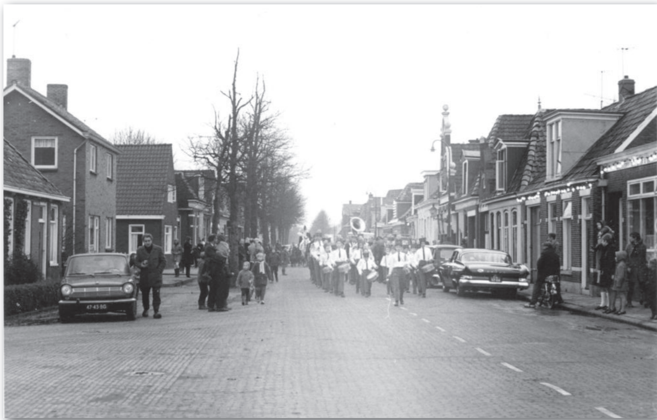
Links Warmoesstraat 42, 40, 38 enzovoort, ± 1969