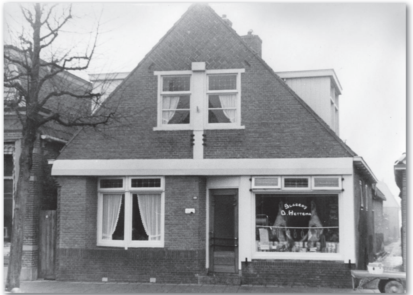
Slagerij D. Hettema met interessante doorkijk in de Spinhuissteeg, 1965