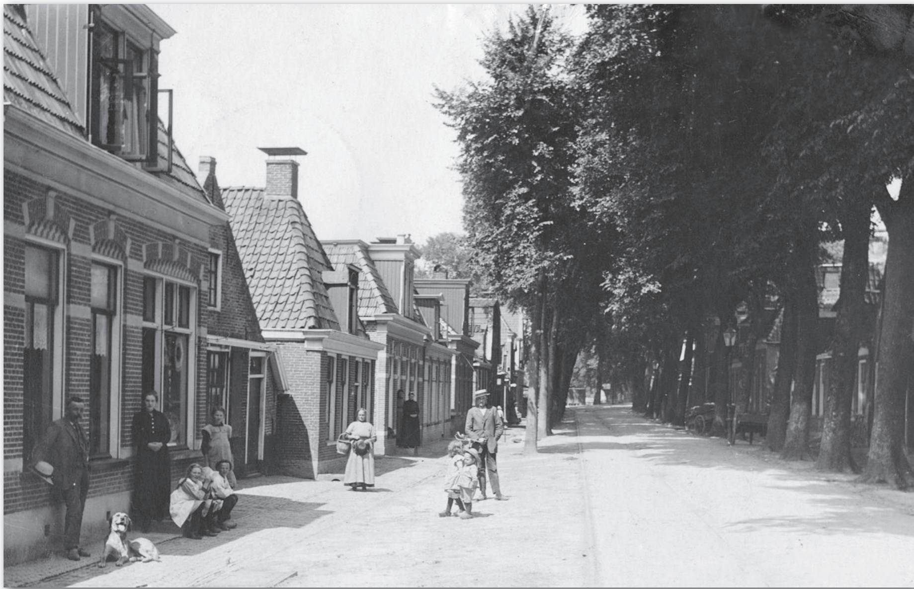
Uiterst links het winkelhuis van Doede van der Wal, ± 1913