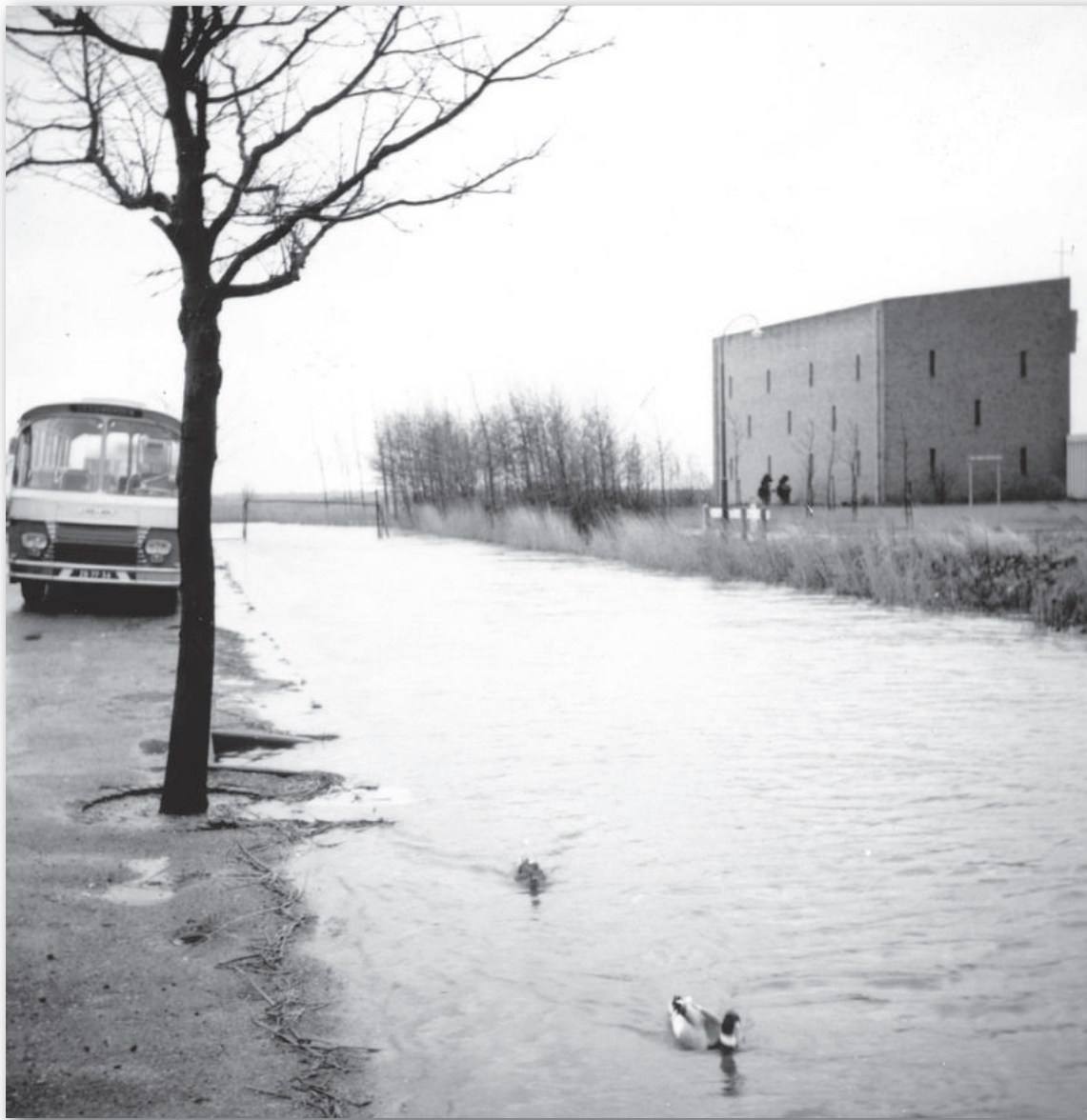
Hoog water in 1965 tegenover Kade 21