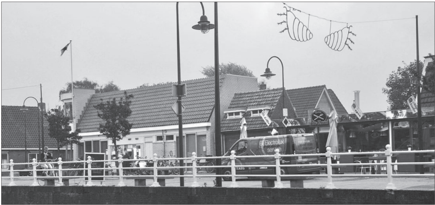
Dezelfde plek anno 2014.