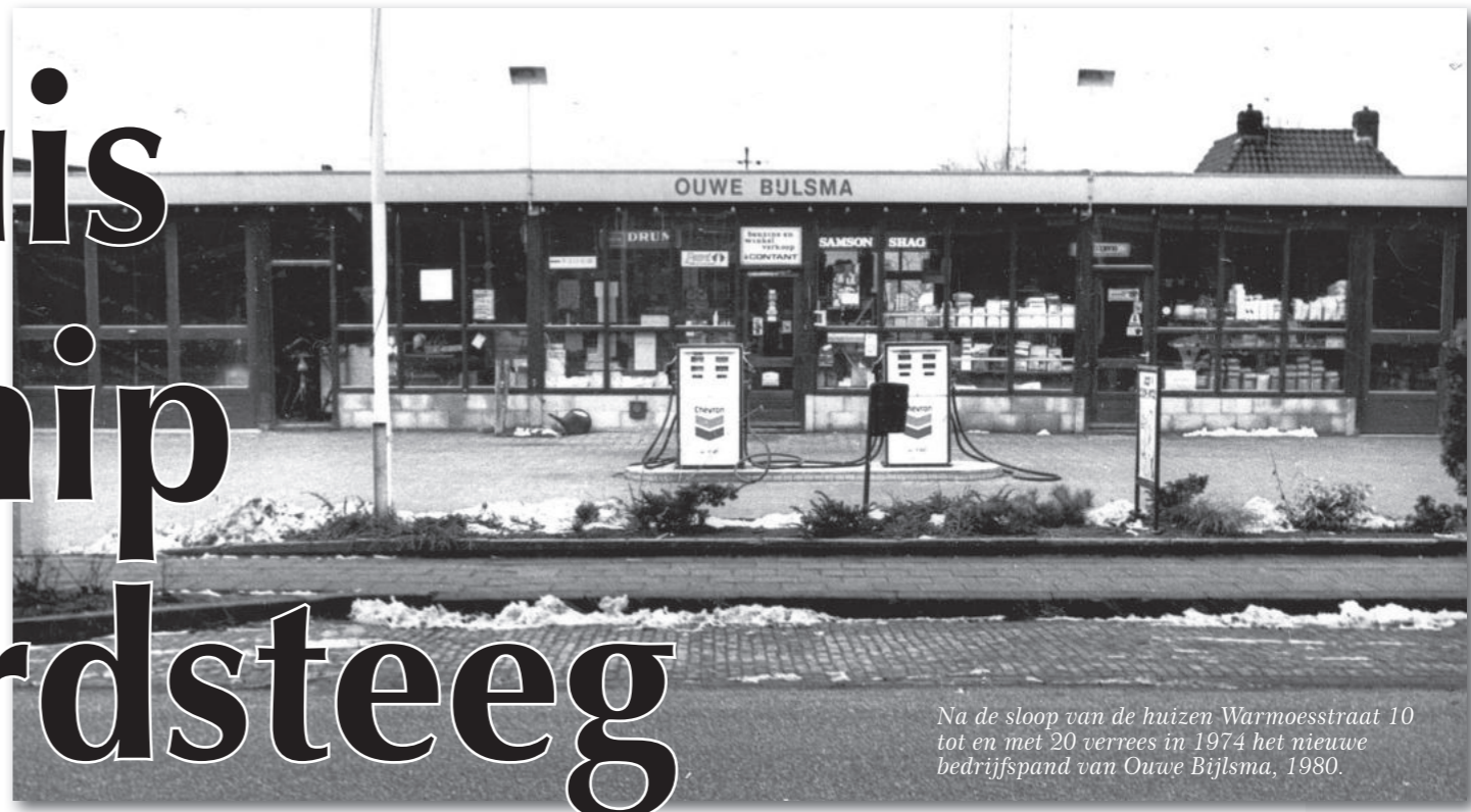
Na de sloop van de huizen Warmoesstraat 10 tot en met 20 verrees in 1974 het nieuwe bedrijfspand van Ouwe Bijlsma, 1980.