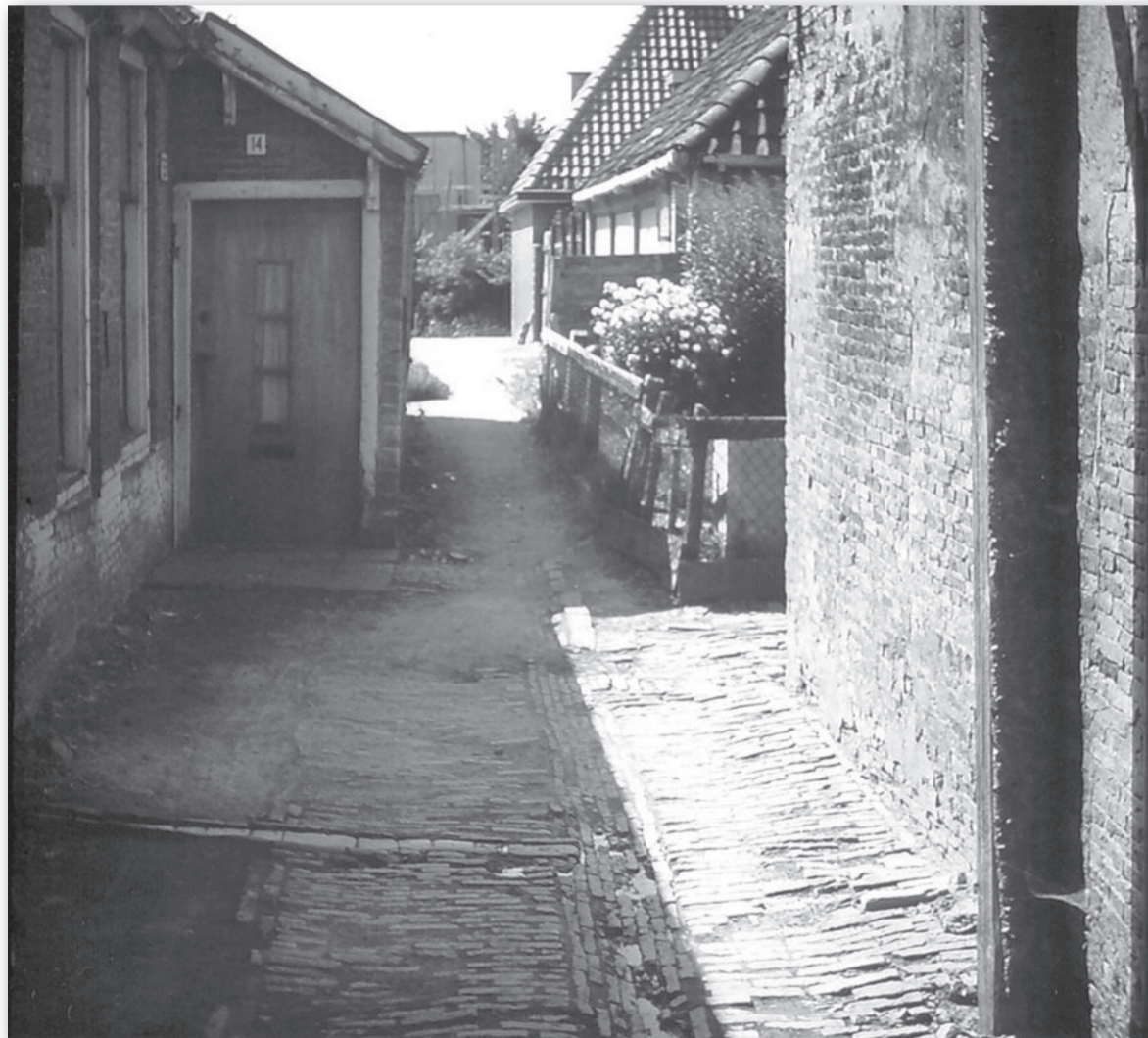
De Noordersteeg in volle glorie met het zicht op de telefooncentrale, met rechts: Warmoesstraat 10, Warmoesstraat 12 en Kade 5 en links: Warmoesstraat 16 en Warmoesstraat 14, 1968-1970