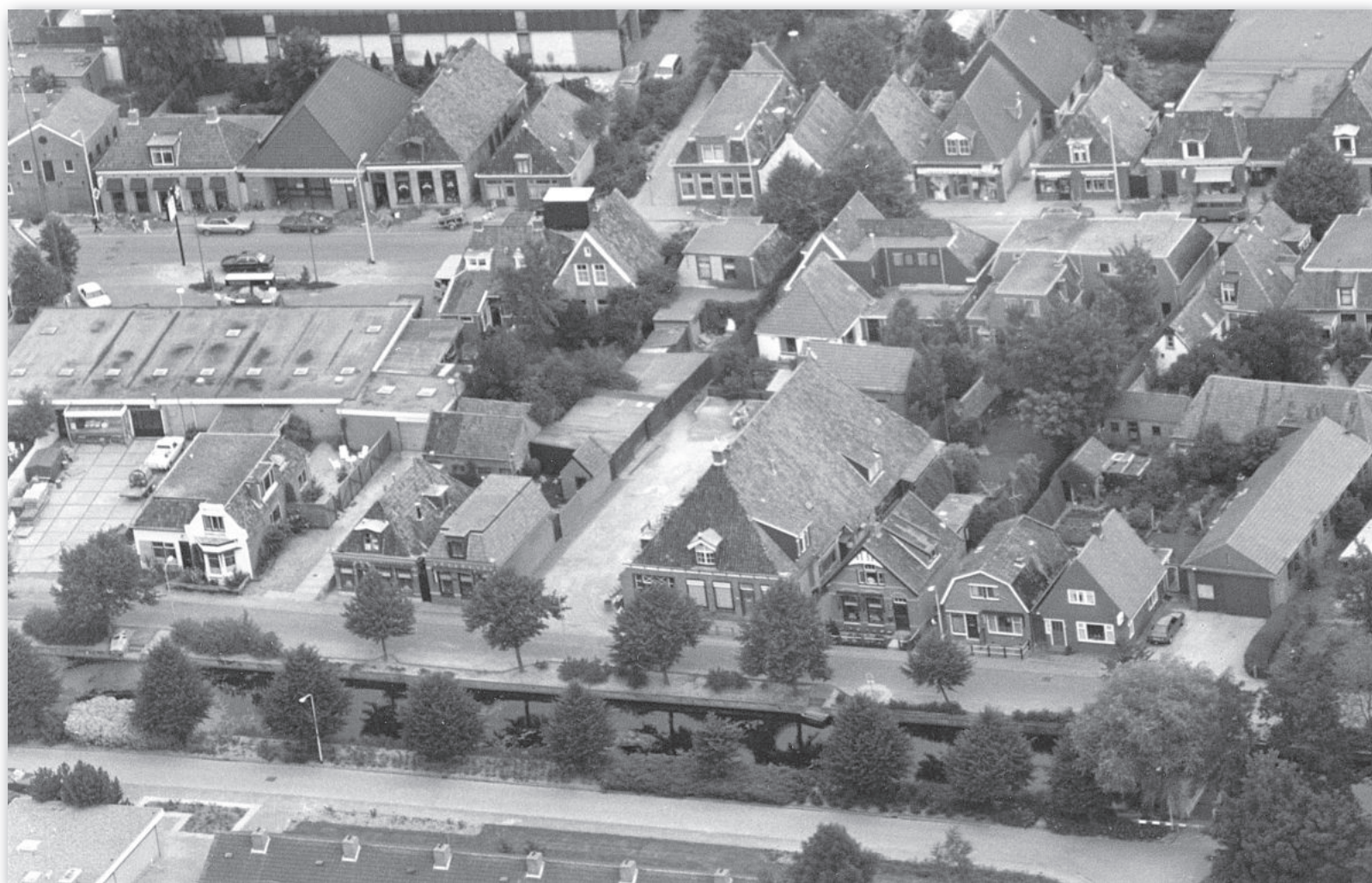
Zoek op de luchtfoto van ± 1979 Kade 13 en de loop van de voormalige Kneppelsteeg.