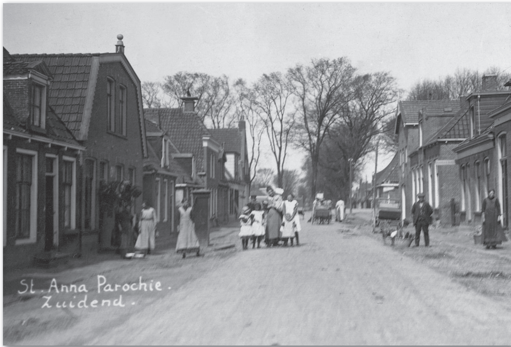
Het tweede pand van links met het mansardedak is Warmoesstraat 18. De bomen zijn net geroid. Achter de vrouwspersoon staat de postbus, 1918