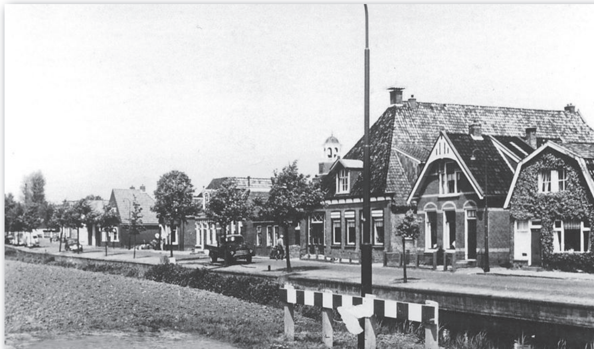
Postma's timmerschuur (Kade 17) is beeldbepalend in 1959

We wandelen over het aloude krui- en looppad ten zuiden van de timmerschuur terug naar de hoofdwoning: Kade 17. Het timmerbedrijf groeide. In 1952 namen de gebroeders Postma de zaak