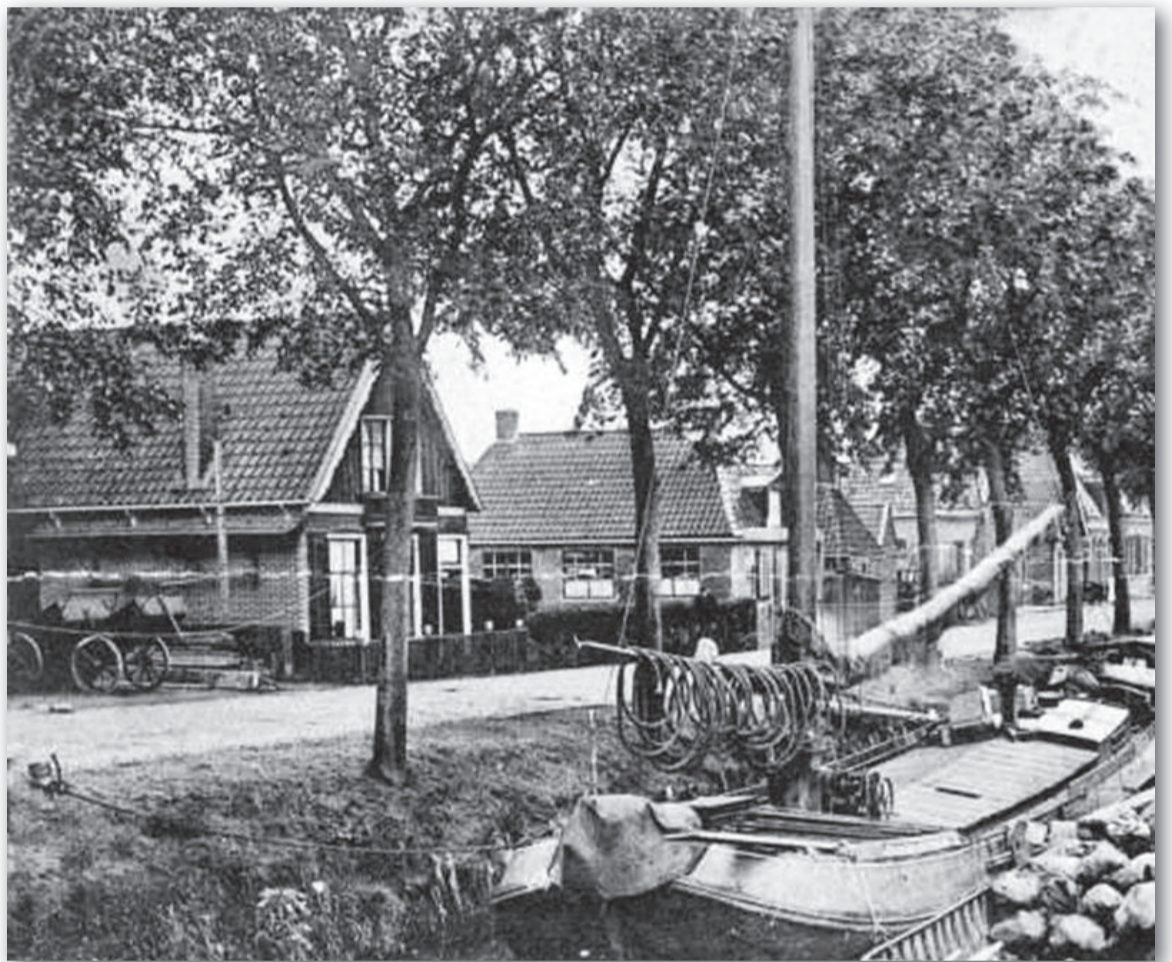
Uiterst links Kade 3. De boom blokkeert het uitzicht op het balkon, ± 1930