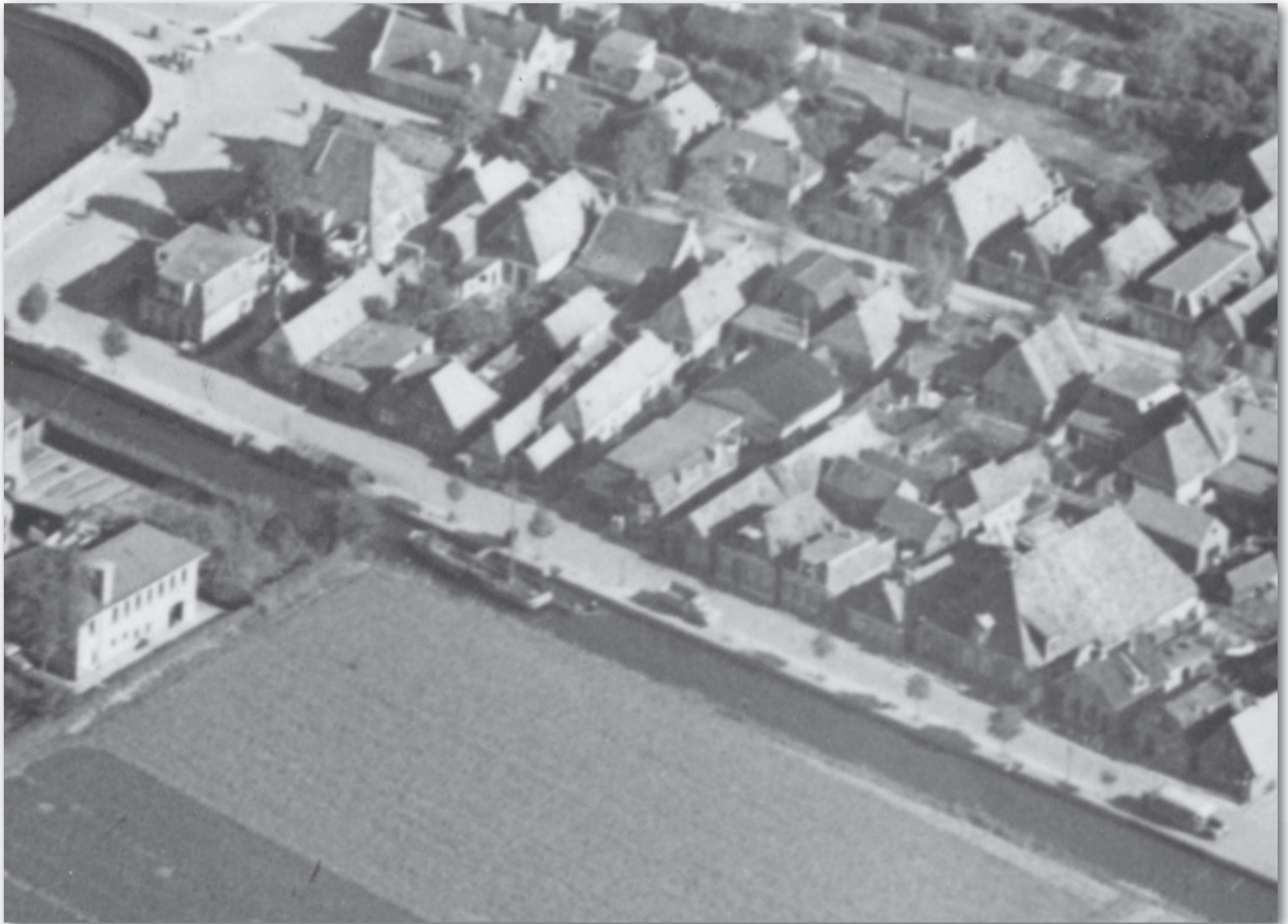
In vogelvlucht: de bebouwing aan de Noordersteeg met halverwege Warmoesstraat en Kade de woning van Thijs van Dussen (Warmoesstraat 12), 1952

de houten hokken waarin Minke en Rikje zich tijdelijk ophielden, waren niet meer dan berghokken. Al deze bouwwerken, van steen en van hout, zijn op een oude luchtfoto van 1932 nog duidelijk te ontwaren. Het houdt in dat de Noordersteeg in 1932 aan de zuidkant helemaal, van Kade naar Warmoesstraat, was omgeven met bouwsels, op één plekje na: het pad (in feite ook een steegje) tussen de Noordersteeg en de Boterhoek achter Warmoesstraat 16 en 14 langs. Tot zover de bebouwing ten zuiden van de Noordersteeg. Nu de noordzijde.