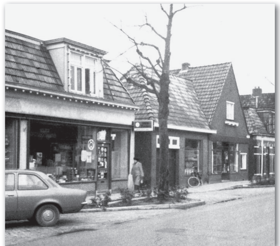
Het huisje ten noorden van de naamloze steeg maakte plaats voor onder meer een garage (achter de boom) en werd samengevoegd met het winkelhuis van firma Wesseling, ± 1980