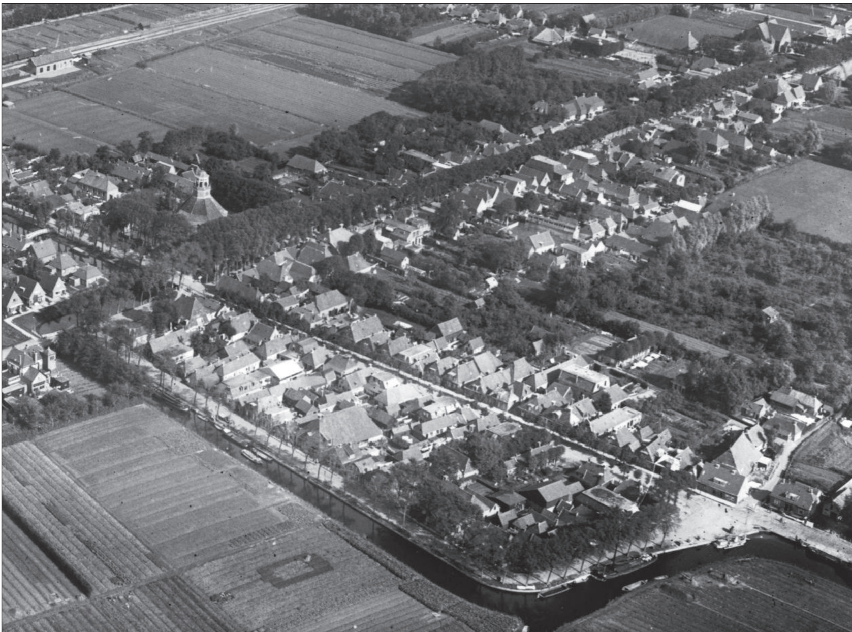
De bebouwing tussen Warmoesstraat en Kade, 1932.

brede straat, evenzeer als de vaart zelf, wederom dringend herstel. De raad riep weer een commissie van onderzoek in het leven, bestaande uit de eigenaars van de huizen en erven langs het Zuideinde. Deze kwam in 1857 met het oude plan: omliggend der vaart ten westen van de huizen. Het plan stuitte op veel tegenstand, niet alleen bij de raad, maar ook bij de Oud-Bildteigenaren, wat betreft de onderhoudsplicht. Zo sudderde de zaak voort. Maar in de laatste raadsvergadering van 1860 kwam de commissie met omliggende plannen waarmee de meerderheid van de raad wel instemde en in 1861-1862 kwam het grote werk tot stand. De Zuidervaart werd gedempt, de Nieuwe Vaart alsmede de Kolk gegraven, de bestrating van het verbrede Zuideinde vernieuwd, de oude pijp op de Hoek met de stenen vleugels weggenomen en meer naar het westen de Westerbrug gelegd.