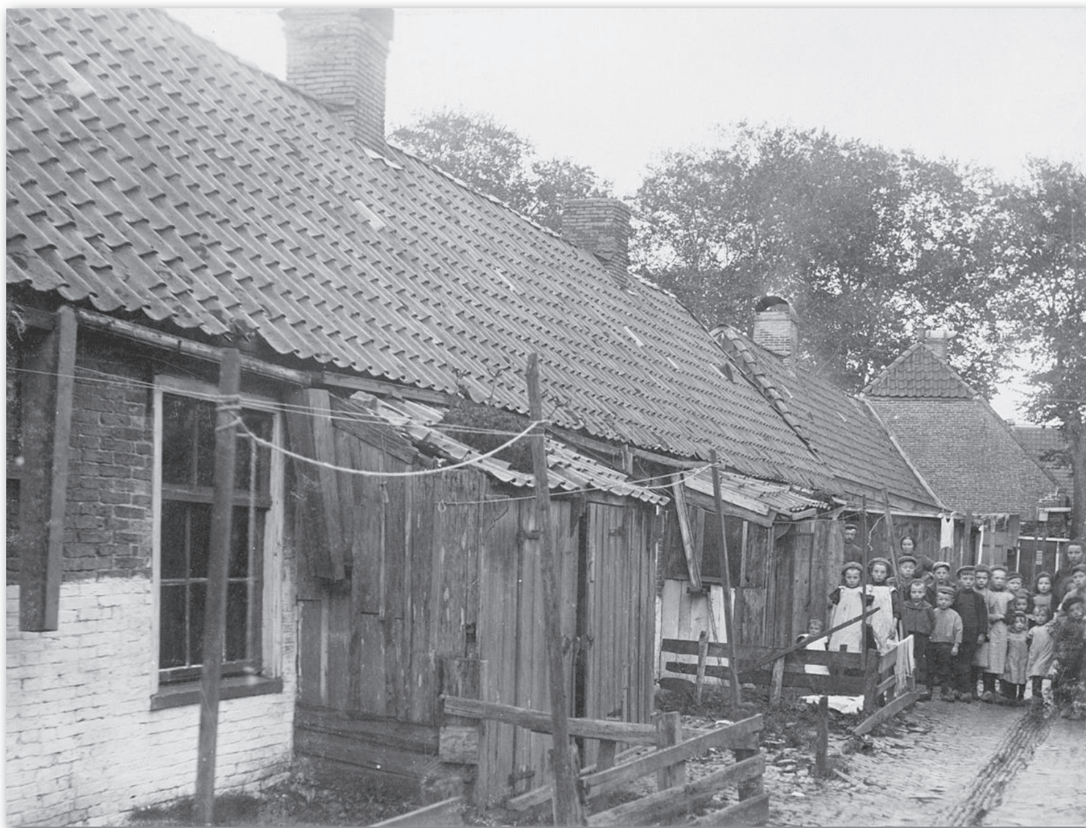
De Spinhuissteeg in 1912. We staan in het achtertuintje van Kade 21 met het gezicht naar het oosten. We zien van veraf naar dichtbij: de top van de bomen in de Warmoesstraat, de achterkant van Warmoesstraat 32, de drie diaconiehuusjes, achttien kinderen en vijf kamers van het Spinhuis met de vervallen portaaltes.