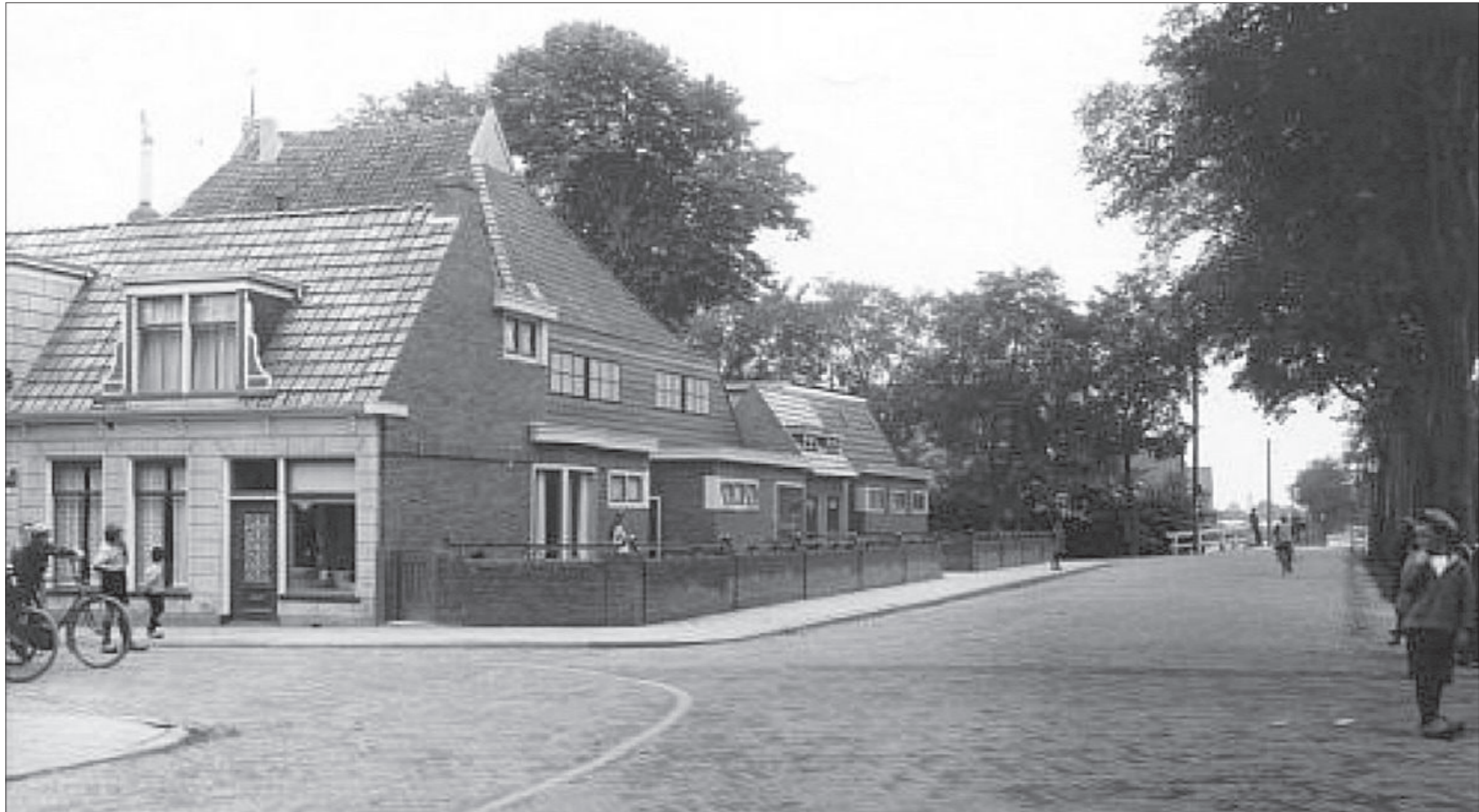
De hoedenwinkel van 'Myn en Wyp', het latere Van Harenstraat 6, heeft in 1930 de voordeur nog aan de Warmoesstraat.

Het pand dat we vorige week behandelden, was tot in het jaar 1929 het hoekhuis. Vanaf het moment van de sloop van dat huis was het pand dat nu aan de beurt is, het hoekhuis. De woning had tot 1950 de voordeur aan de Warmoesstraat, daarna aan het Westeinde of Westerdijk, maar toen in 1964 de straatnamen officieel werden ingevoerd, stond het huis te boek als Van Harenstraat 6 (Van Harenstraat 4 was de vervinkel van Braakma en Van Harenstraat 2 was het PEB-transformatorhuisje). De straatnamencommisatie koos ervoor om de Van Harenstraat vanaf de Westerbrug te laten lopen, terwijl van ouds de Westerweg/Westerdijk vanaf de Hoek westwaarts liep. Verwarrend. Het was eleganter geweest om het stukje straat gewoon de Statenweg te noemen. En om het nog verwarrender te maken: het PEB-huisje heeft anno 2014 Van Harenstraat 2 als adres en de huidige Rabobank Van Harenstraat 4, terwijl cafetaria-lunchroom De Kaai geen adres heeft, maar toch zeker wel aan de Westerweg-Westerdijk-Van Harenstraat-Statenweg staat. Van 1718 tot 1910 vormde Van Harenstraat 6 met het zuidelijker staande huis (ooit Warmoesstraat 4) een pand. Sinds 1991 zijn beide percelen wederom verenigd in de Rabobank, die dus gek genoeg nu Van Harenstraat 4 als adres heeft. Wij volgen de oude nummering en doen deze week Van Harenstraat 6.