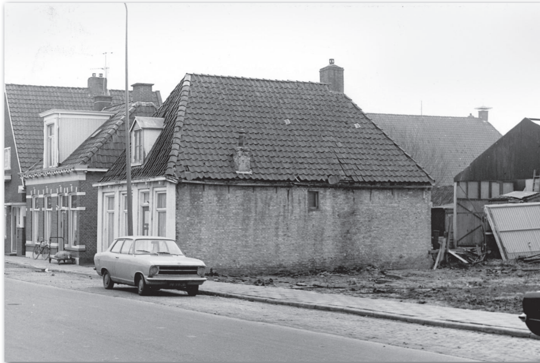
Vl.n.r. Warmoesstraat 24, 22 en 20 in 1974. Ten noorden van het in 1906 nieuw gebouwde middelste huis liep de Lommerdsteeg van het Zuidende naar de Nieuwe Kade.