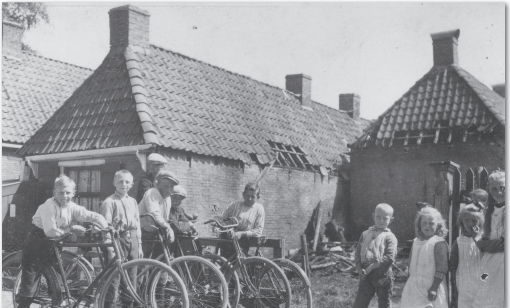
Behalve veel kinderen en fietsen zien we het bebouwde erf tussen Kade 7 en 5 met v.l.n.r. het voormalige bierhuis (nu Kade 5), de drie kamers ten zuiden van de Noordersteeg en het westelijke van de drie diaconiehuisjes ten noorden van de Boterhoek in desolate toestand.