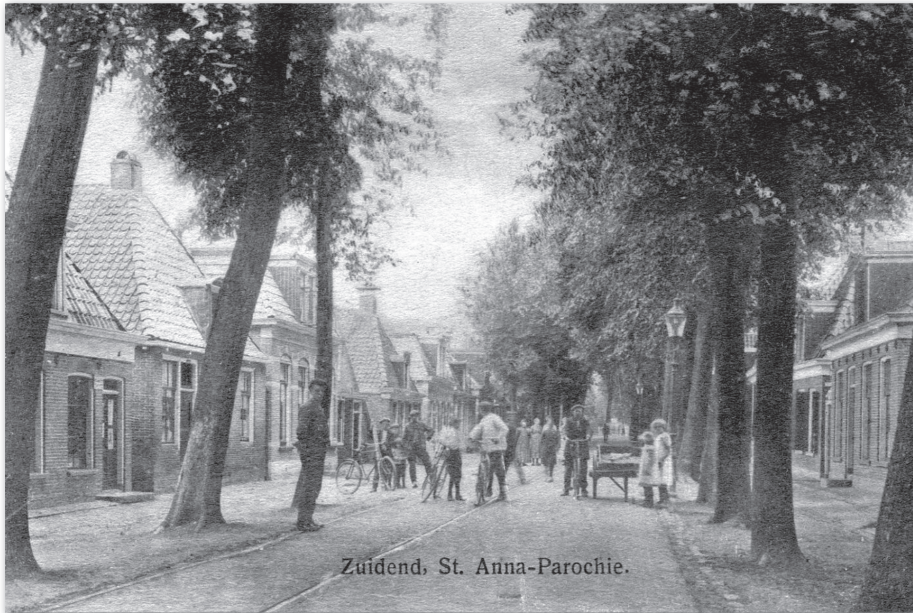
Uiterst links Warmoesstraat 34, nog met schilddak, ± 1911