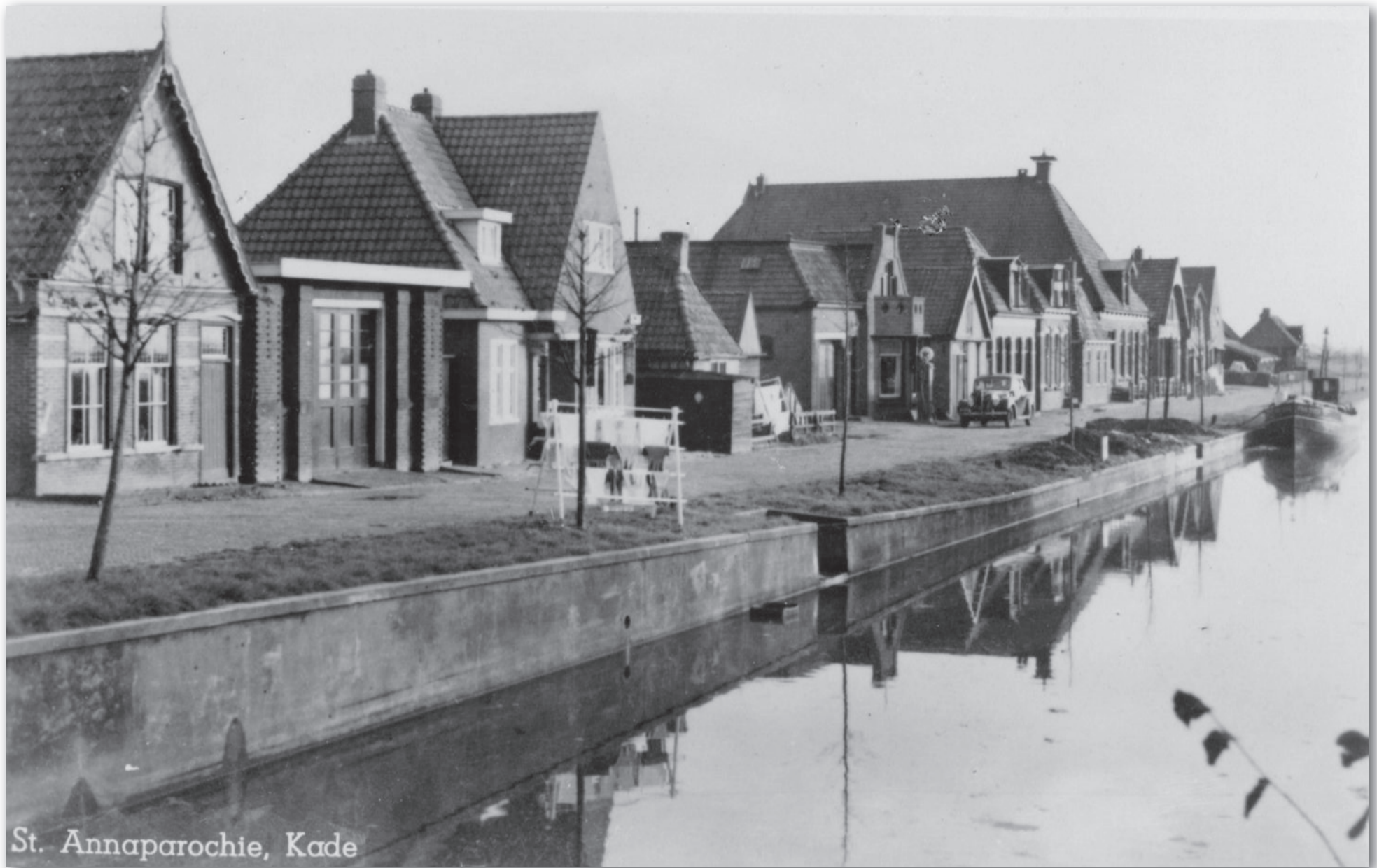
St. Annaparochie, Kade

Wasdag op de kale Kade! V.l.n.r. Kade 3, de garage-werkplaats van Van Reenen en het nieuwgebouwde Kade 5, 1942