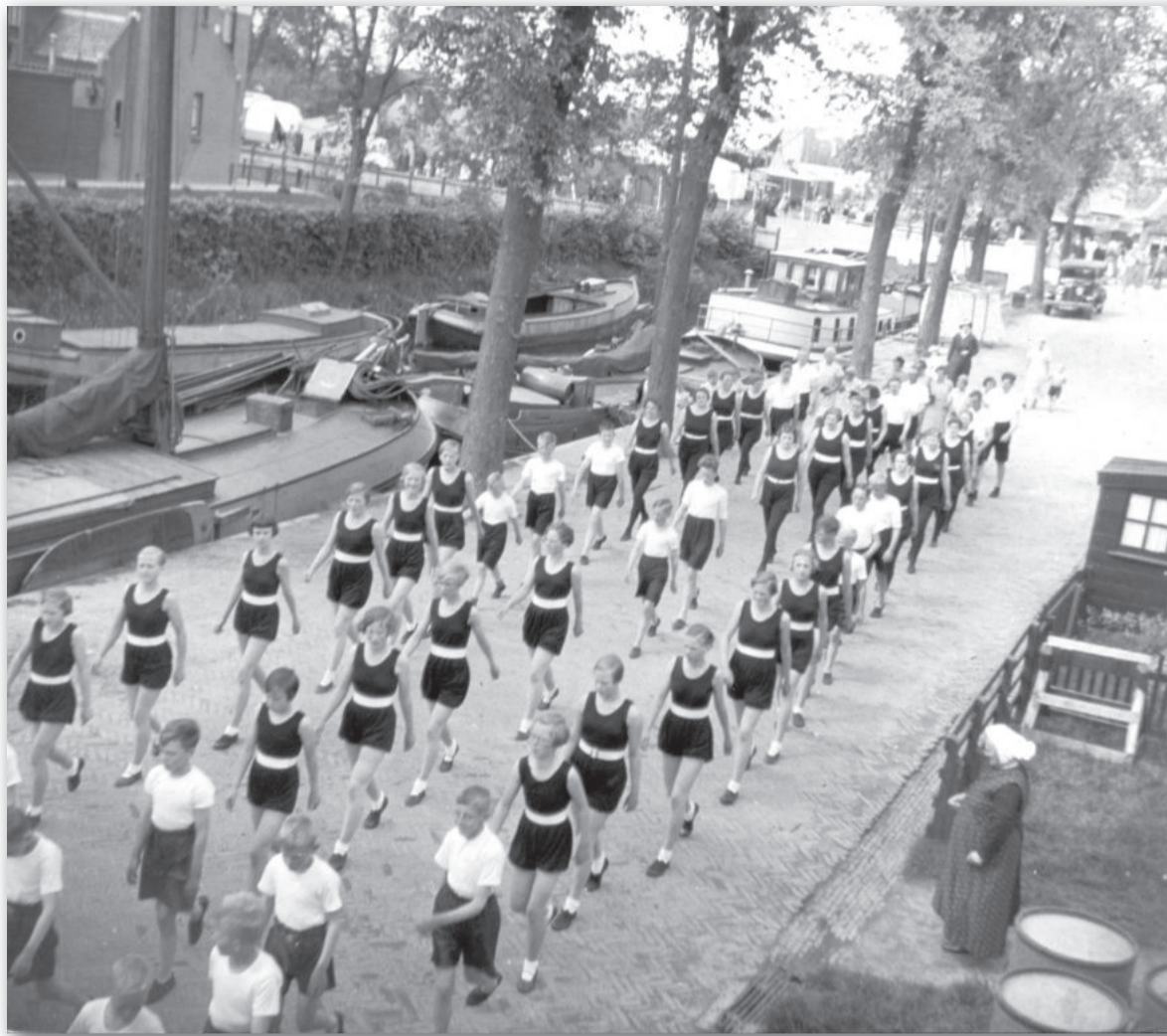
Uit een verrassende hoek uitzicht op erf, tuin, bouwsel en vrouw met muts tussen Kade 7 en 5, maandag 25 mei 1936

Dus de diaconiehuisjes stonden "in de Boterhoek." Waarom Boterhoek? Is deze buurt tussen de twee stegen met het verbindingspad en de negen huisjes genoemd naar de Boterhoek te Leeuwarden? Het heeft er alle schijn van. Er waren meer Boterhoeken in de omtrek. In Berlikum was een buurtschapje met deze naam en er was de Boterhoekslaas tussen Hallum en Oudebildtzijl. Deze plekken waren genoemd naar een weiland dat als boterhoek bekend stond; een vruchtbaar stuk weiland waar koeien graasden die vette melk gaven. Ook de Leeuwarder Boterhoek zal zo aan de naam zijn gekomen, maar de Boterhoek tussen Warmoesstraat en Kade is niet genoemd naar een weiland. Het zal inderdaad genoemd zijn