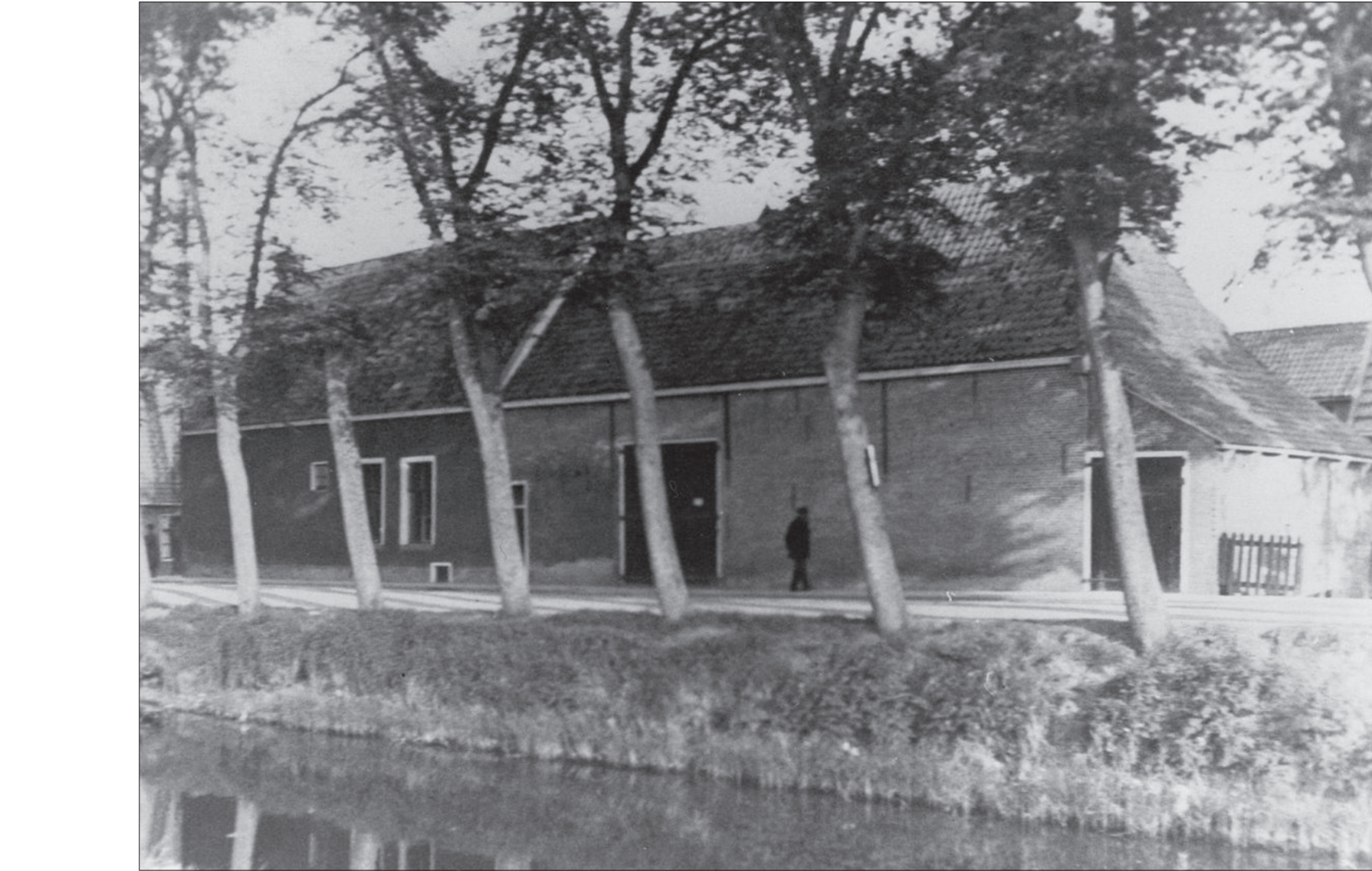
Huize Westra met uiterst links de Warmoesstraat en uiterst rechts het dak van Kade 1, ± 1916.