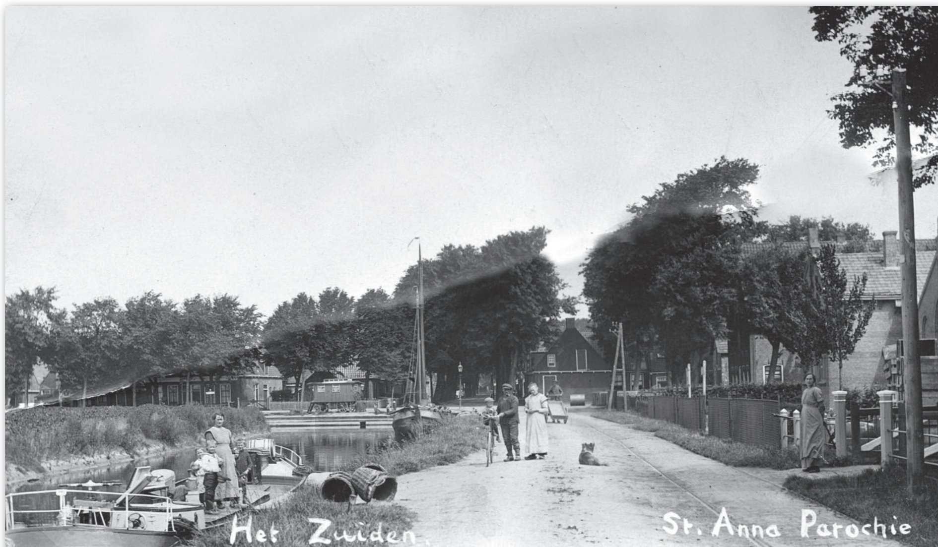
De Zuiderhoek, ± 1912