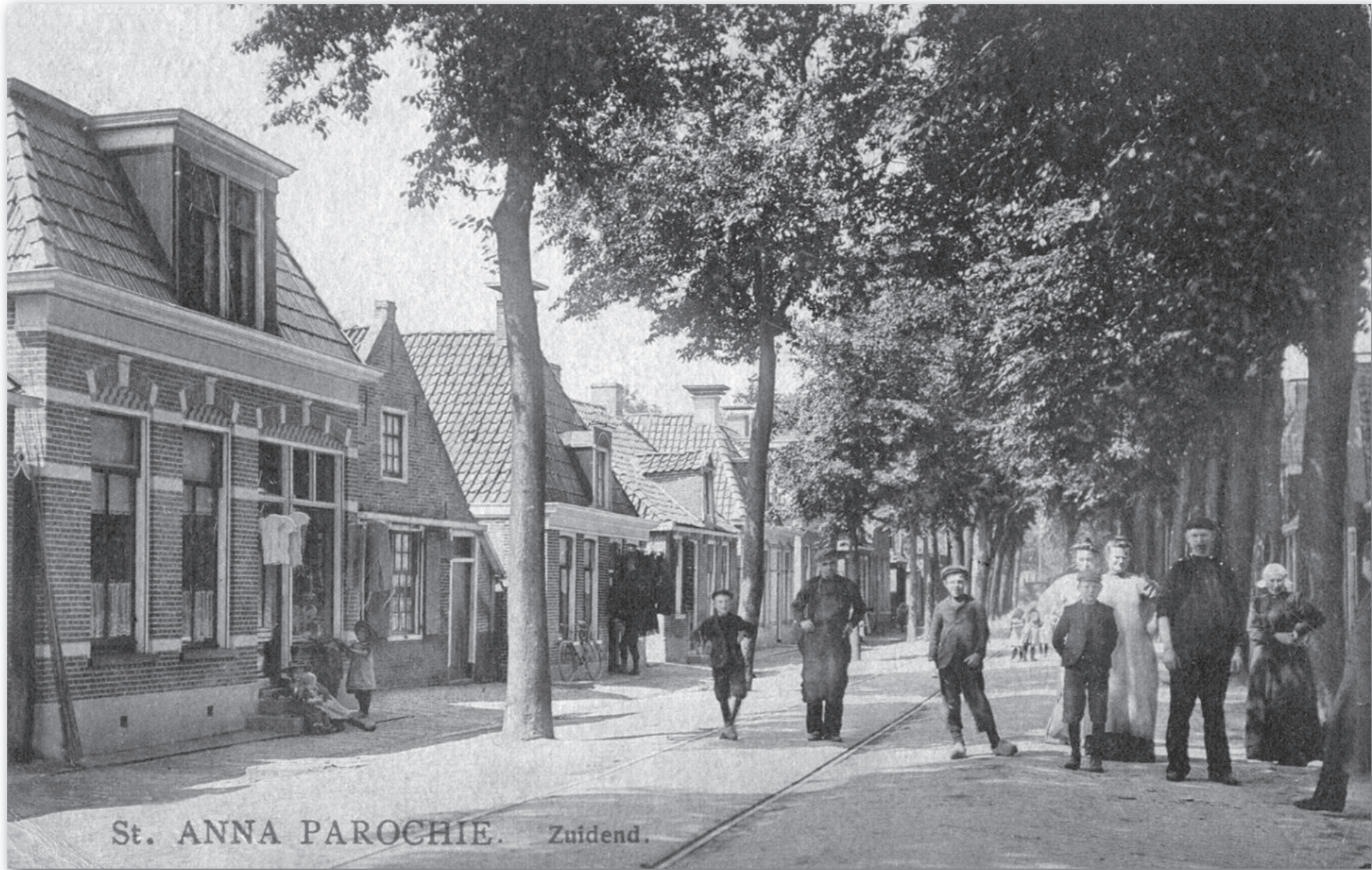
Tweede huis van links: de ver uit de rooilijn staande topgevel in de zomer van 1910 (nu zuidelijk gedeelte schoenenzaak Wassenaar). De lange man in het zwart is smid Siebren Bosch. Hij is aan de wandel, want hij hoort thuis in Warmoesstraat 38

Tabé Gerrits was in 1732 getrouwd met Ijtske Jans. Ze werden beiden geboren in Vrouwenparochie. Het echtpaar woonde hier. Ijtske overleed en Tabé hertrouwde op 4 januari 1750 met Imkje Hiddes (kwam van St.-Annaparochie). Ook dit echtpaar woonde hier, maar niet lang want in hetzelfde jaar overleed Tabé. Nu trouwde Imkje Hiddes reeds op 13 december 1750 met Oeds Minnes (kwam van Oenkerk). Ook dit echtpaar woonde hier. In 1752 werd dochter Vroukje geboren. Imkje Hiddes stierf, waarschijnlijk in het kraambed. Oeds Minnes hertrouwde nu in 1753 met Grietje Johannes en zij verhuurden in 1758 een kamer aan schipper Jan Willems. Door alle wisselingen van huwelijkspartners was Oeds Minnes eigenaar geworden en hij