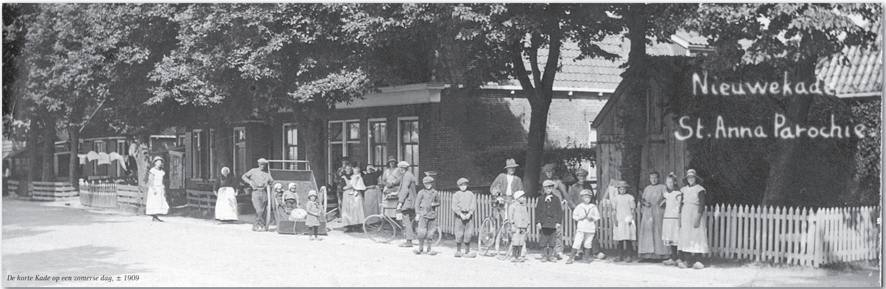
De korte Kade op een zomerse dag, ± 1909