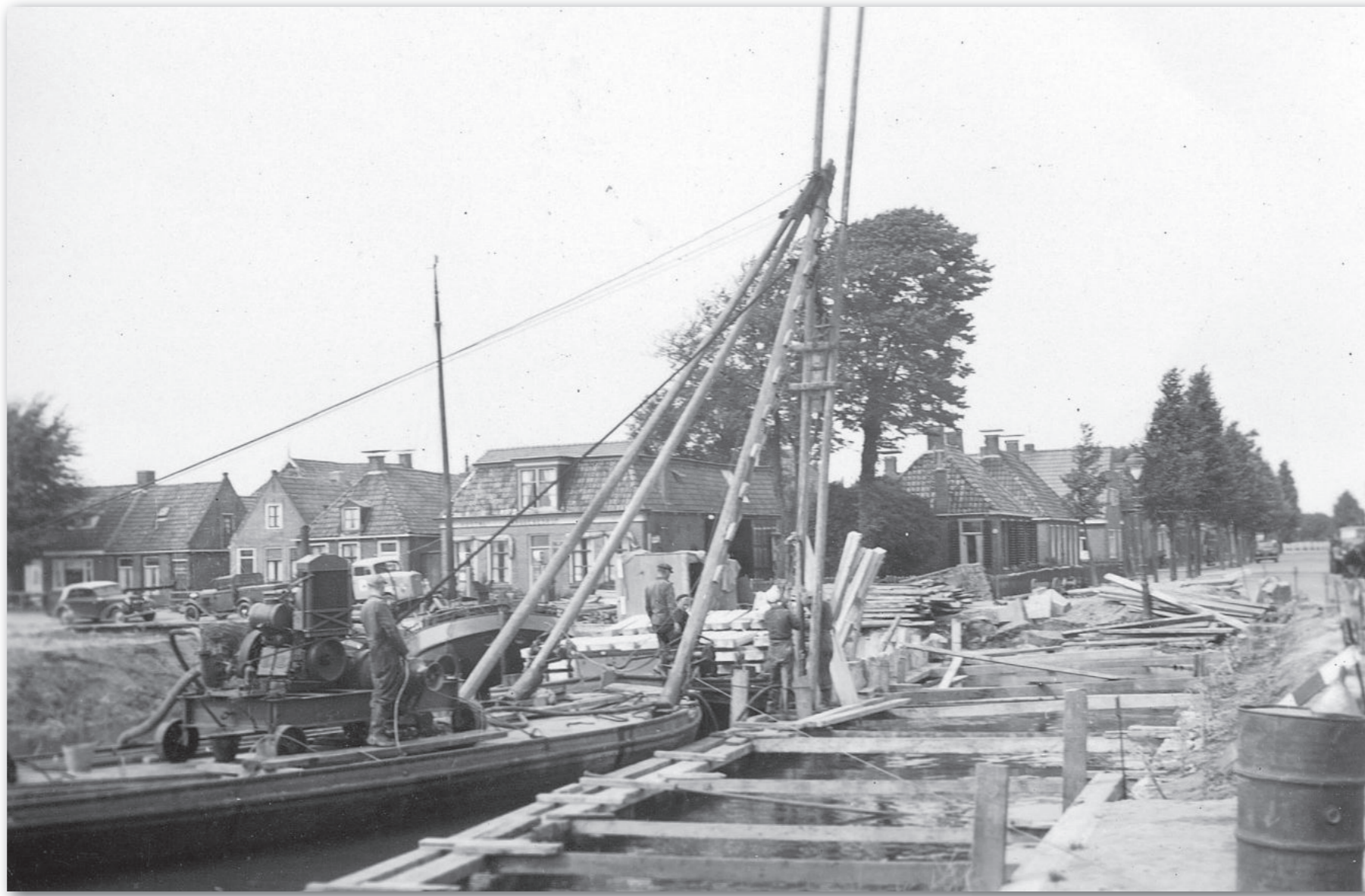
Uiterst links Kade 31 en 33 (nr. 29 is een achterhuis en niet zichtbaar), 1953