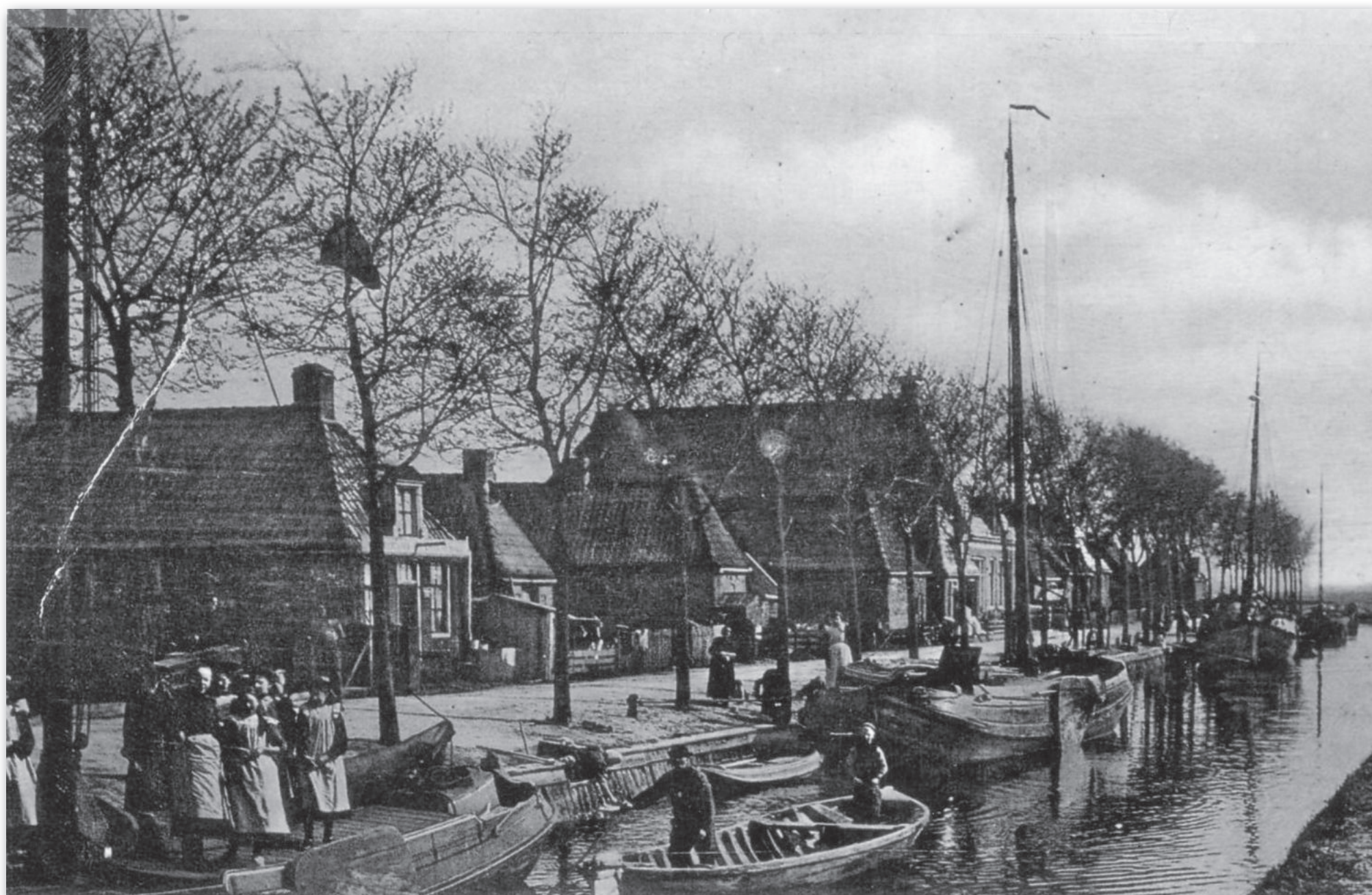
Bebouwing, tuinen en stegen aan de Kade in 1902 met v.l.n.r. het bierhuis De Zwarte Mustang (Kade 5), de Noordersteeg, kamers ten zuiden van die steeg, tuin met onzichtbare diaconie-huisjes, de Boterhoek, de zeven-onder-een-kap (Kade 7), de Lommerdsteeg, tuin (ooit Kade 9), een glimp van het huisje van Roelke Kalverboer (Kade 11), huis met schilddak (Kade 13), de Kneppelsteeg, de schoenmakerij van Job Wassenaar (ooit Kade 15) en de stelpwoning van Wilkeshuis (Kade 17).

privaat. De vloer was soms van hout, soms van steen. De oppervlakte van de huisjes varieerde van 20,25 m 2 tot 16,25 m 2 en elk huisje bestond uit een kamer van 12 m 2 (exclusief twee bedsteden, een haardstede en een kast), een gang en een portaal. Er was geen regenwaterbak in velden en wegen te bekennen. Het verschil in hoogte tussen de kamervloer en de buitengrond was bij het oostelijkste huisje nihil, maar die hoogte was bij het huisje aan de Kade opgelopen tot 10 cm. De huisjes stonden waterpas, maar de grond naar de Kade liep af. Dat was een pluspunt