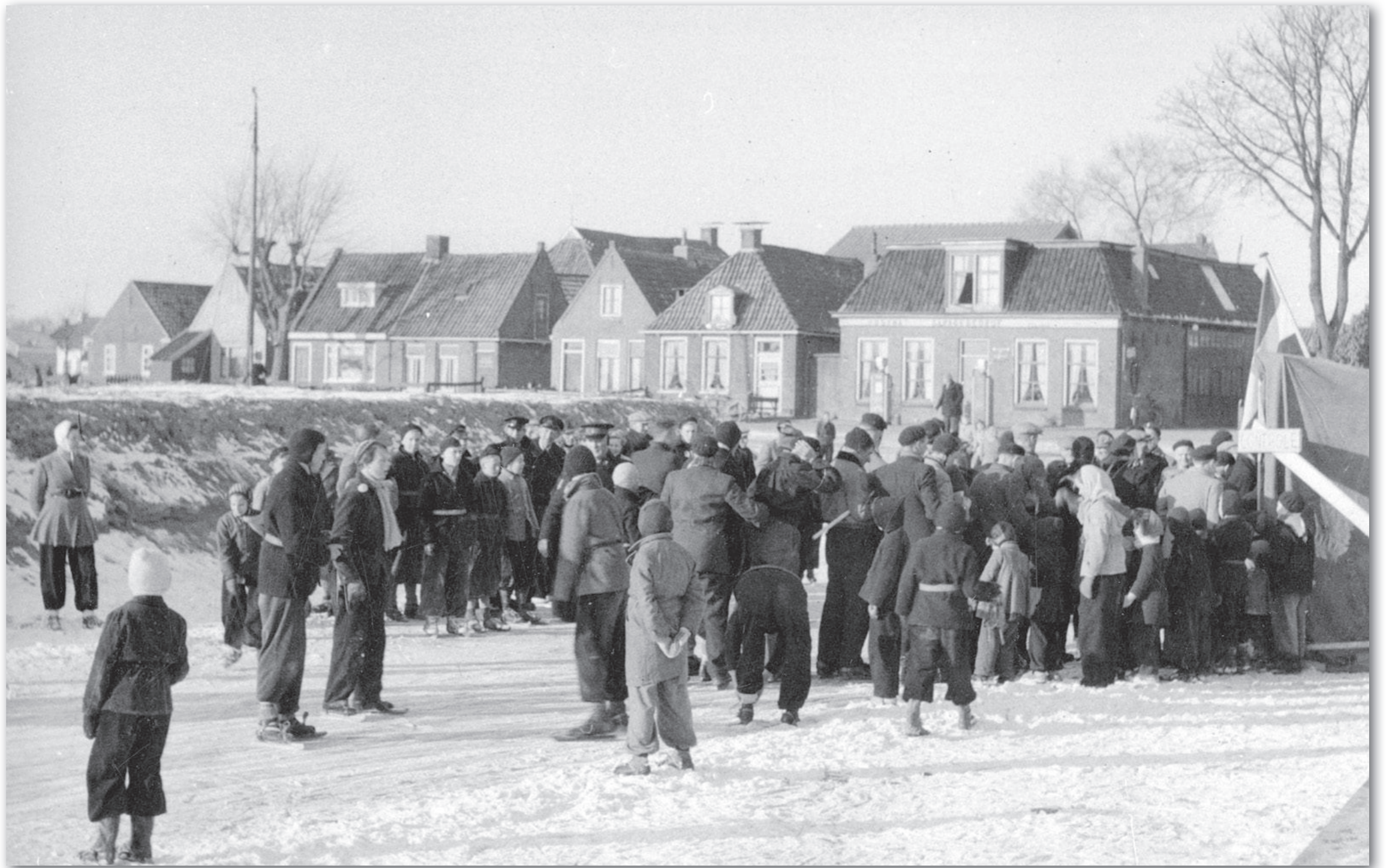
Bildtdorpentocht op zaterdag 11 februari 1956 met v.l.n.r. Kade 27, ongenummerd (met portaalte), 31, 33, 35 (topgevel), ongenummerd (schilddak) en 37.