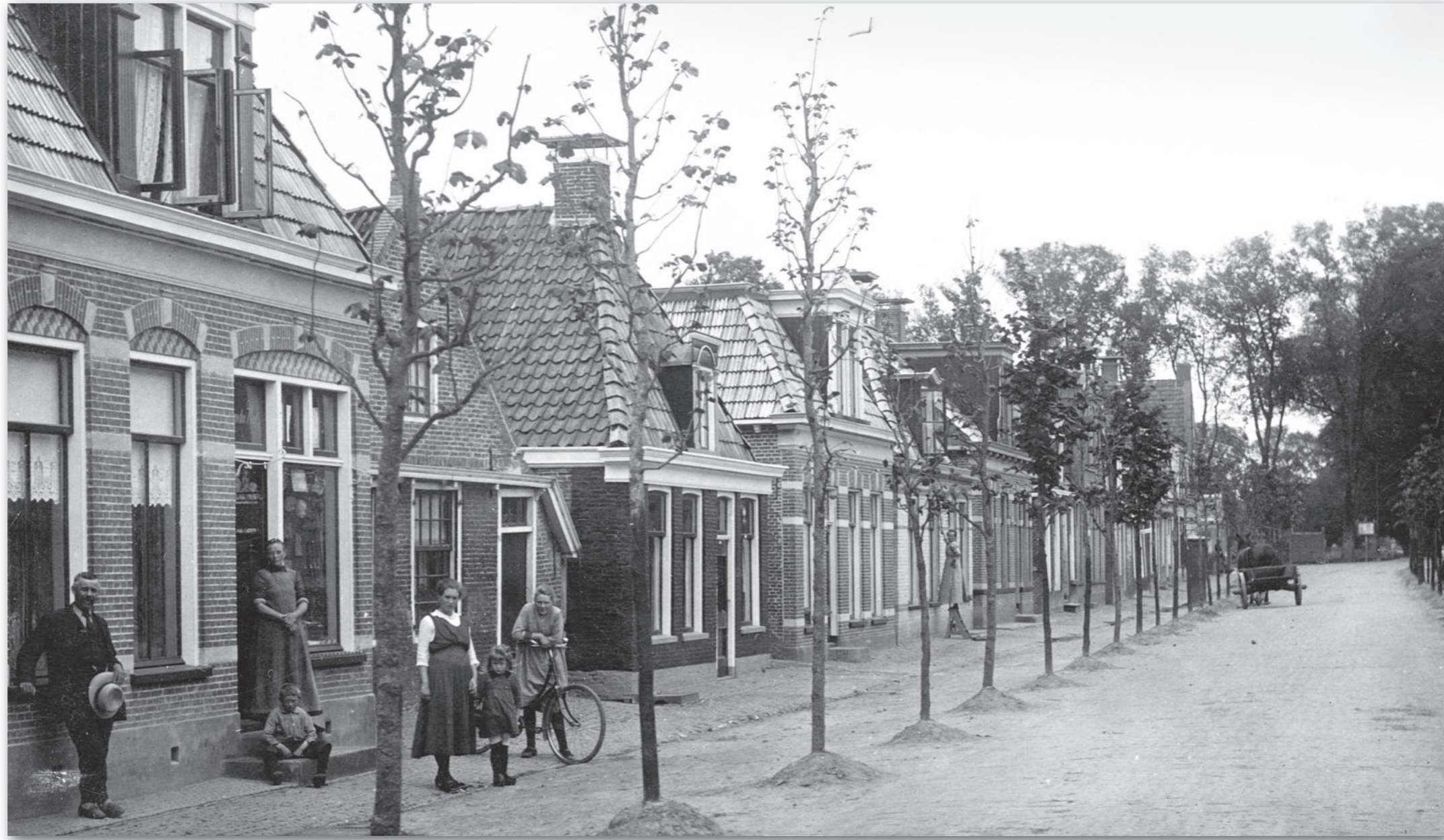
Tel de gevels! De vijfde van links, waar de ramen worden gelapt, met schilddak en kajuit is Warmoesstraat 24, 1918