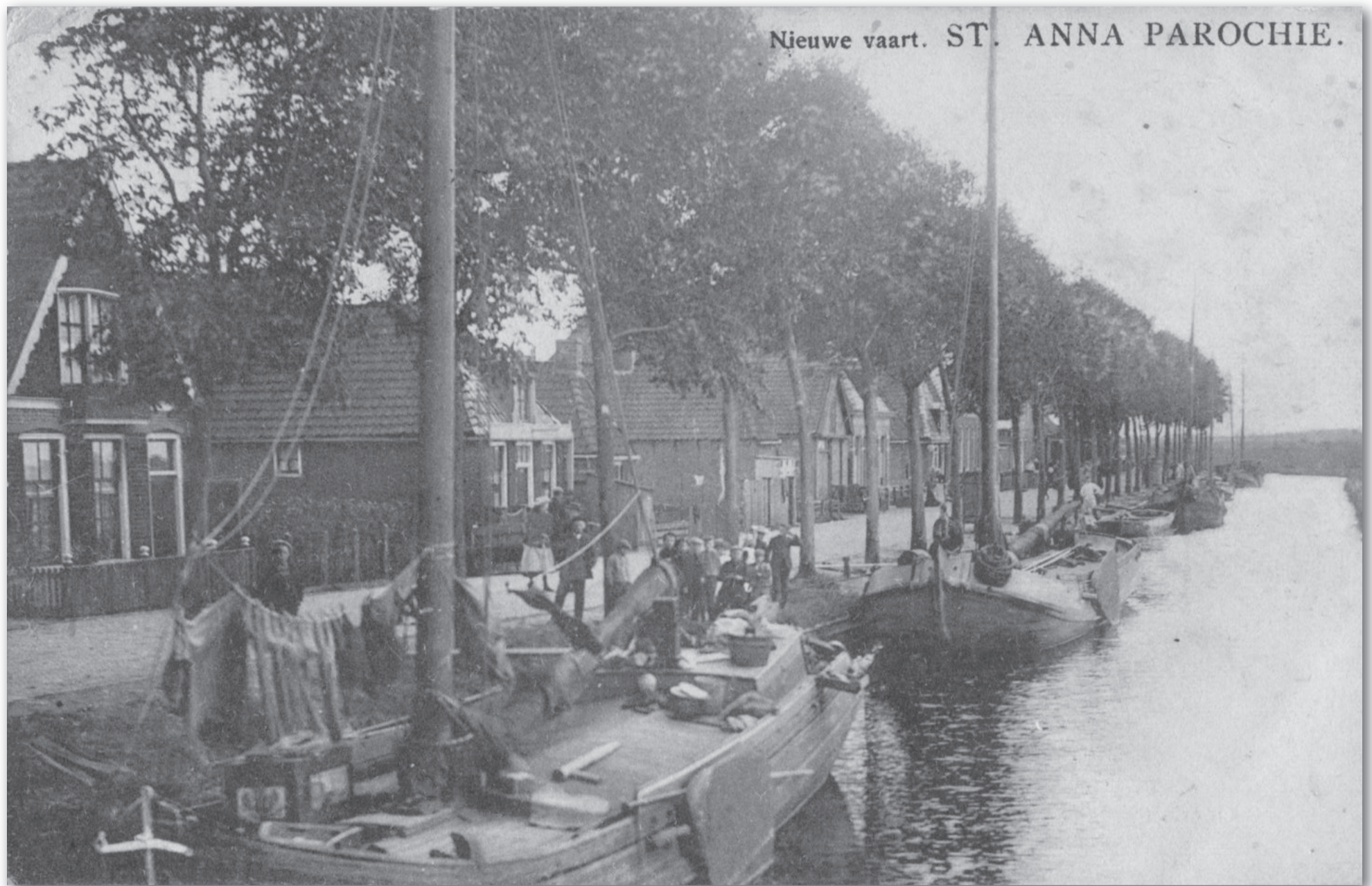
Bebouwing, tuinen en stegen aan de Kade in 1912 met v.l.n.r. Kade 3, tuin (nu garage), het bierhuis De Lachende Romer van Kees Korf (Kade 5), de Noordersteeg, kamers ten zuiden van die steeg, tuin met onzichtbare diaconiehuysjes, de Boterhoek, de zeven-onder-een-kap (Kade 7), de Lommersteeg, de brandstoffschaar (ooit Kade 9), het nieuwe huis van Kees de Bildt (Kade 11) en tuin (Kade 13). Vooraan (zeer waarschijnlijk) het schip van IJde Gerbens Plat.