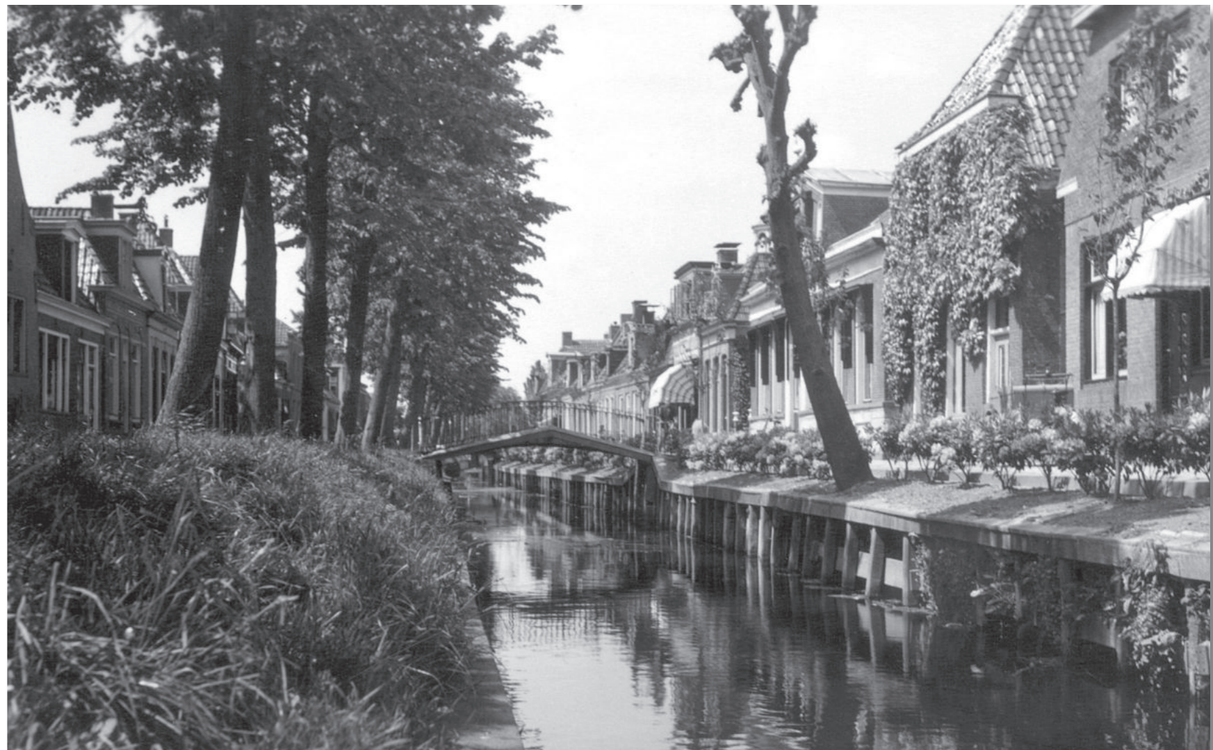
Van Harenstraat 33 gaat schuil achter een klimop (± 1945)

We zullen de komende weken Van Harenstraat nummer 3 tot en met Van Harenstraat nummer 41 passeren en kennismaken met de bewoners.