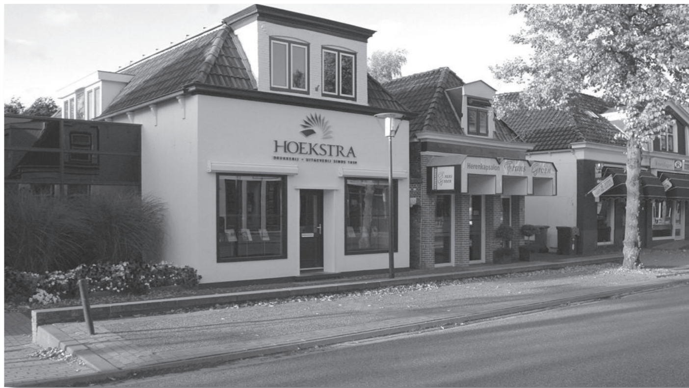
Van Harenstraat 27 in oktober 2007.

In maart 1875 liet Kuiken aanbesteden "het afbreken van een oud en het stichten van een nieuw winkelhuis en boekdrukkerij." Architect E. Kuikstra te Stiens maakte de bouwtekening en op 17 september 1875 verhuisde de drukker dan naar zijn spiksplinternieuwe pand aan de Smalle Kant. Jan Johannes Kuiken werd geboren in 1833 te St.-Annaparochie en was getrouwd met Grietje Everts Siderius. Het echtpaar werd begiftigd met acht kinderen waarvan vijf niet oud werden. In het voorhuis waren de woonkamer en de winkel in boeken en kantoorartikelen ondergebracht en via de steeg die ten oosten van het pand liep, bereikte men de drukkerij.