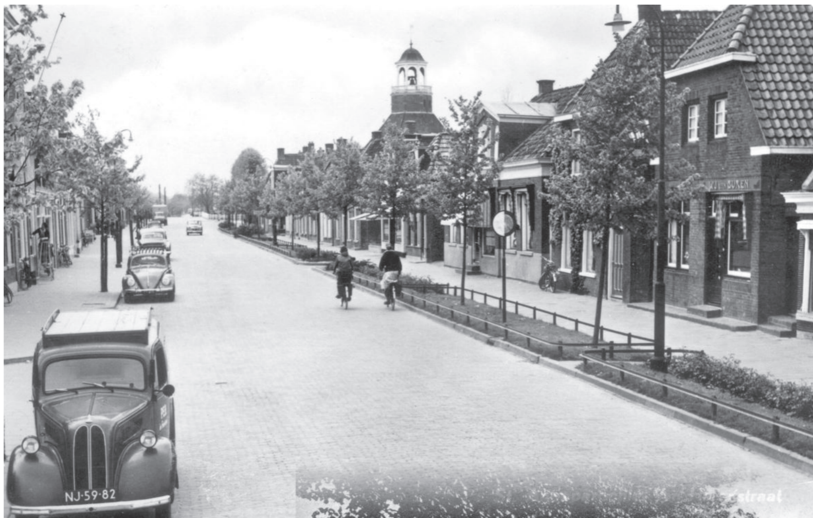
Oostende zonder vaart (± 1960)

Waarom gaan we de komende negentien weken wandelen?