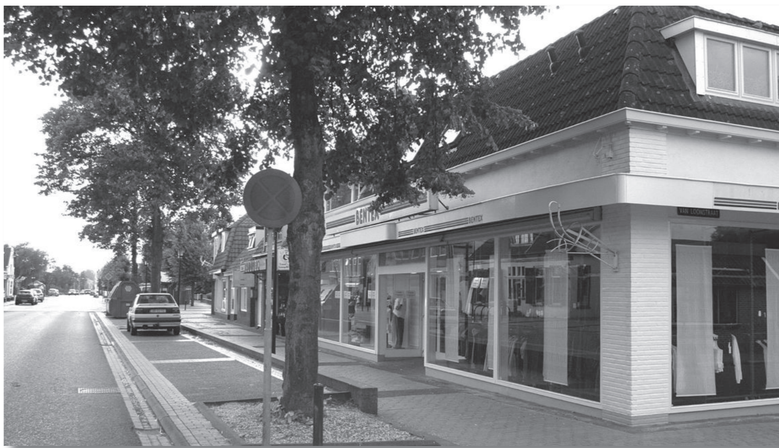
Van Harenstraat 13 in augustus 2007