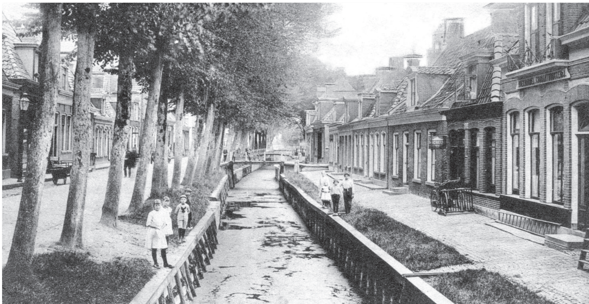
De Oostervaart ligt er idyllisch bij (± 1917).