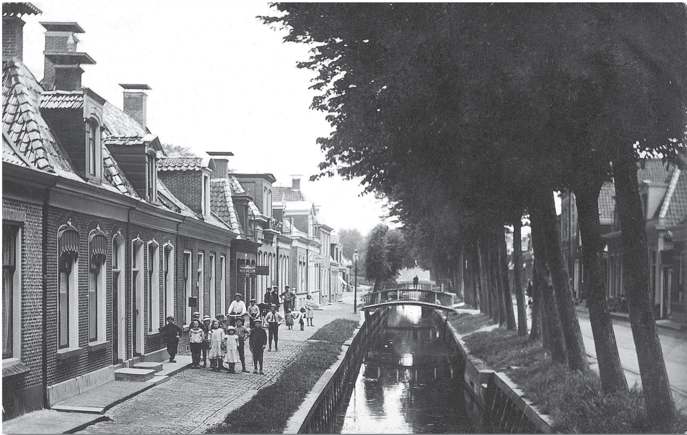
Het eerste, volledig zichtbare huis aan de linkerkant is Van Harenstraat 19. Hier is de Smalle Kant op z'n smalst (± 1915).