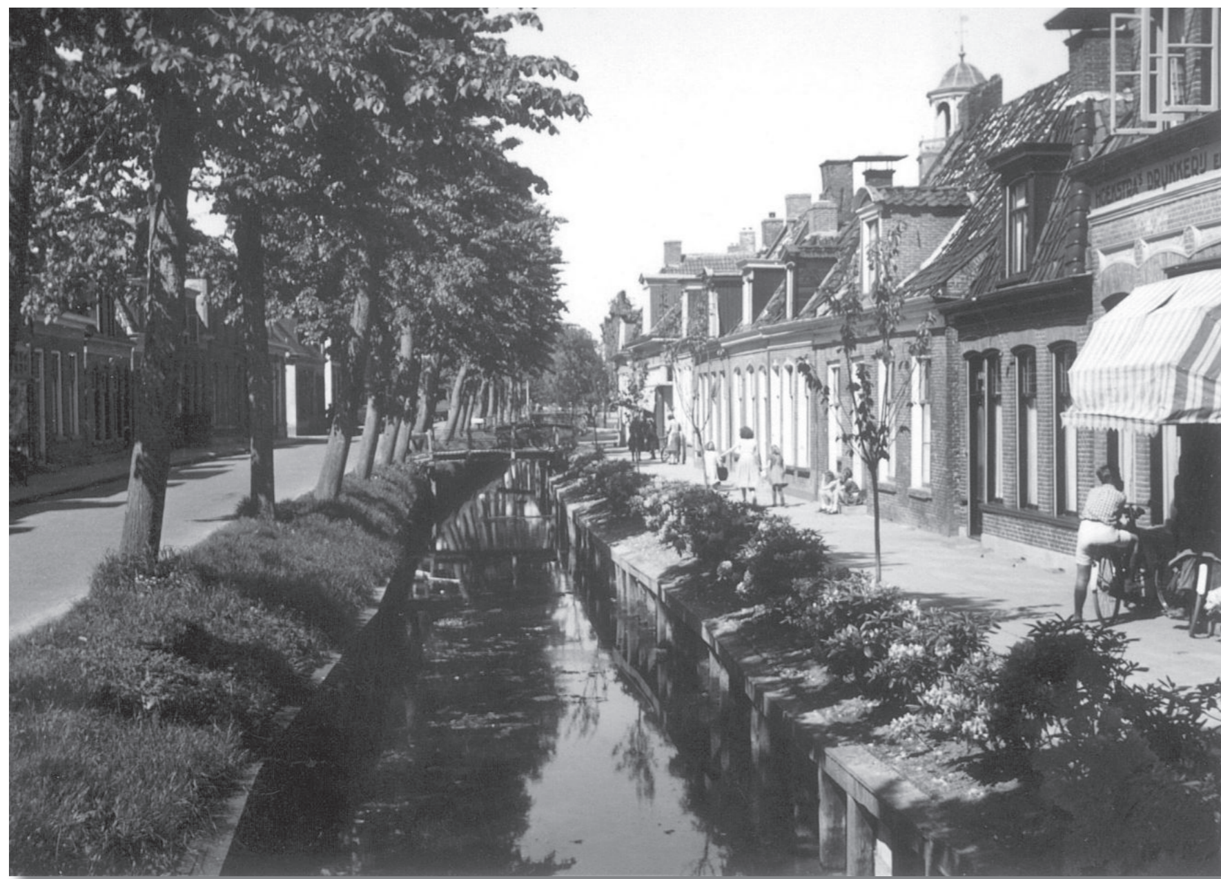
Van Harenstraat ongenummerd, het tweede pand van rechts (± 1949).