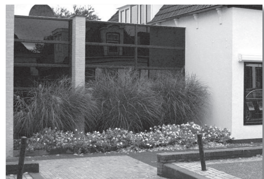
Het 'tuintje' van de Smalle Kant, anno 2007.