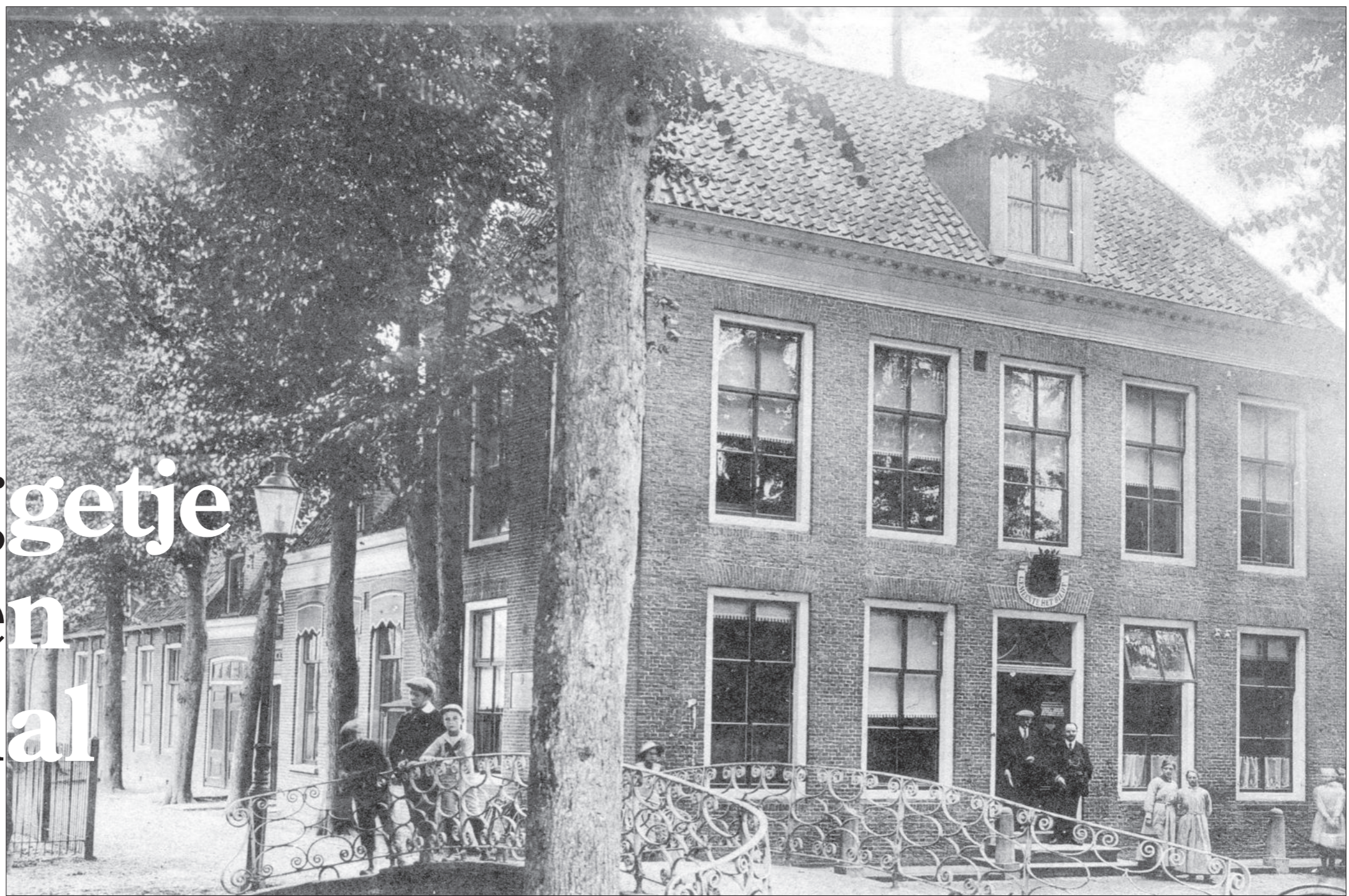
Het oude gemeentehuis, ± 1915