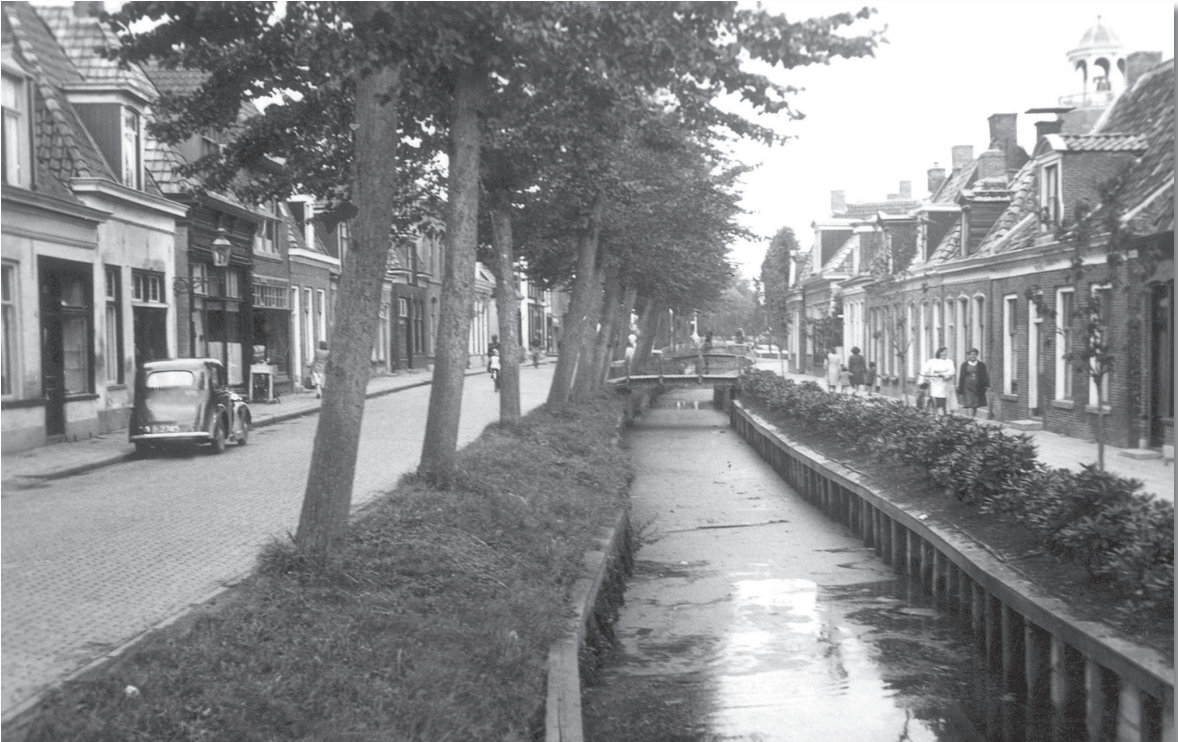
De brede en de smalle kant (± 1949)