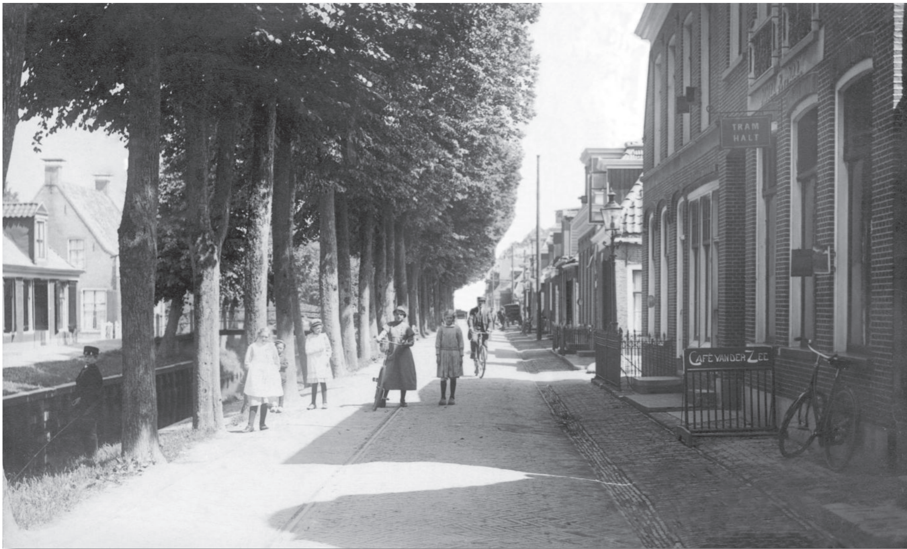
Eigenlijk een foto van de brede kant... maar uiterst links is nog met de voorgevel van Van Harenstraat 41 te ontwaren (± 1915).