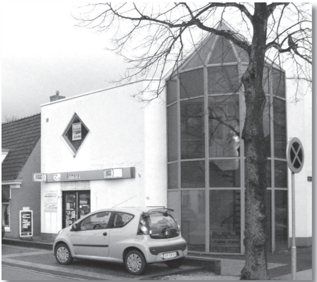
Van Harenstraat 39 in november 2007