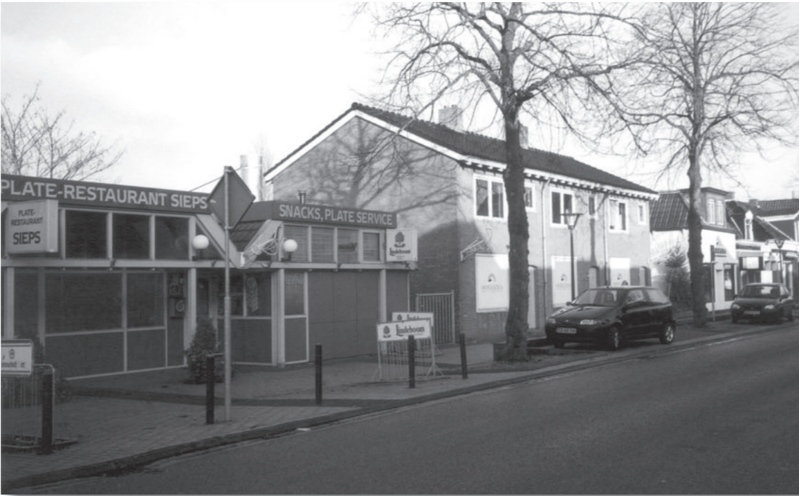
Op de plek van de drie dienstwoningen van drukkerij Hoekstra stonden ooit de bewaarschool en het brede huis.