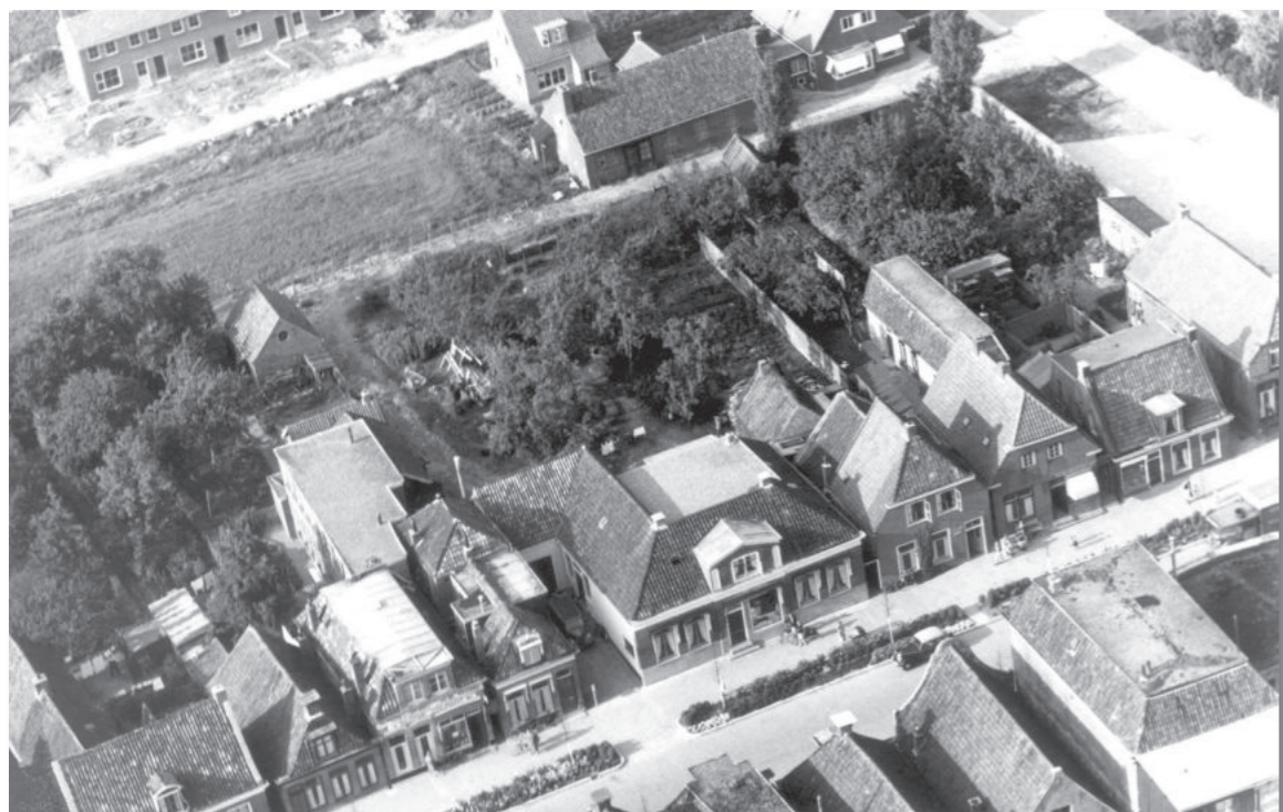
De Smalle Kant vanuit een vliegtuig (± 1955)