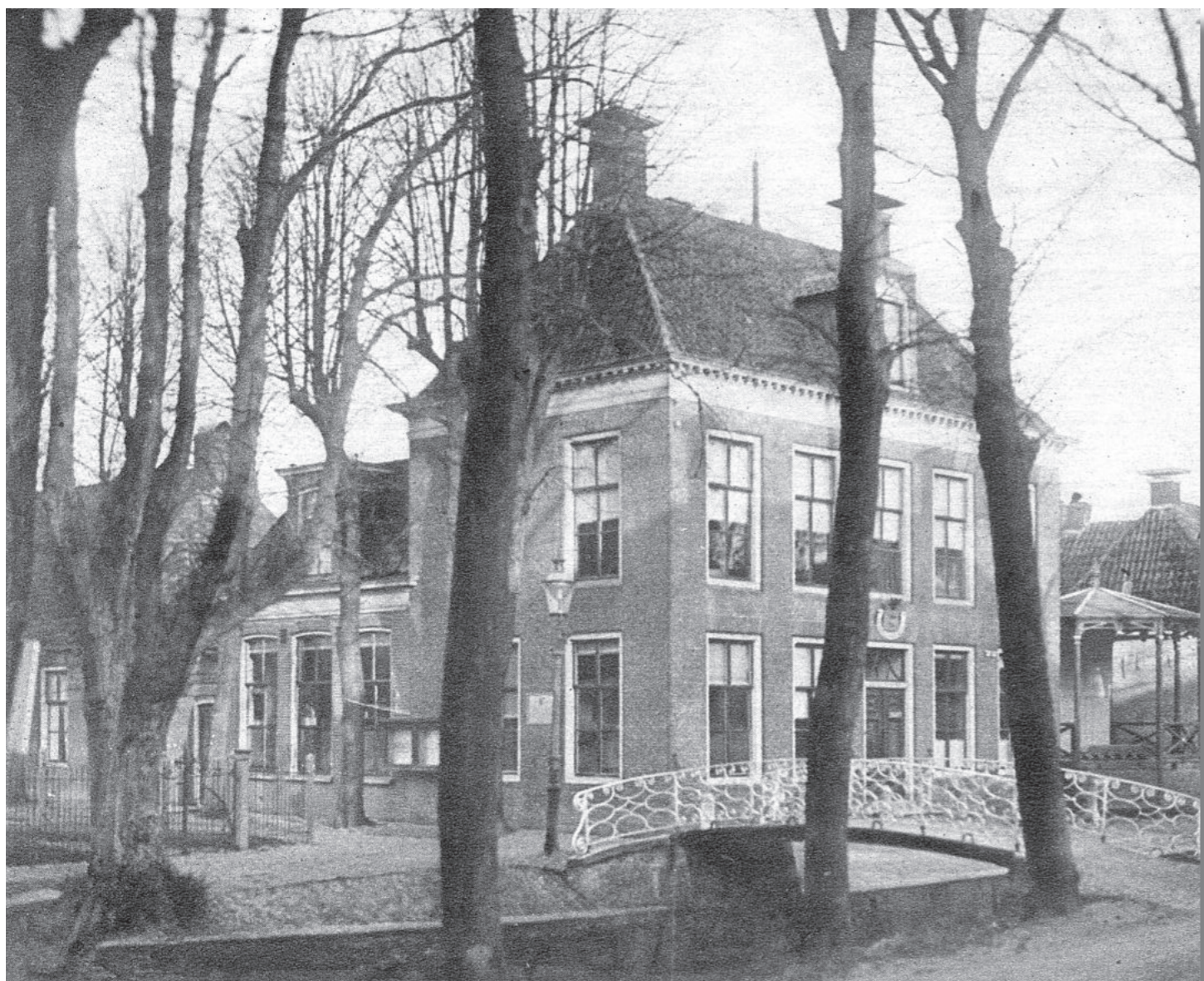
Ten oosten van het oude gemeentehuis staat de muziektent van het korps Excelsior (1926).