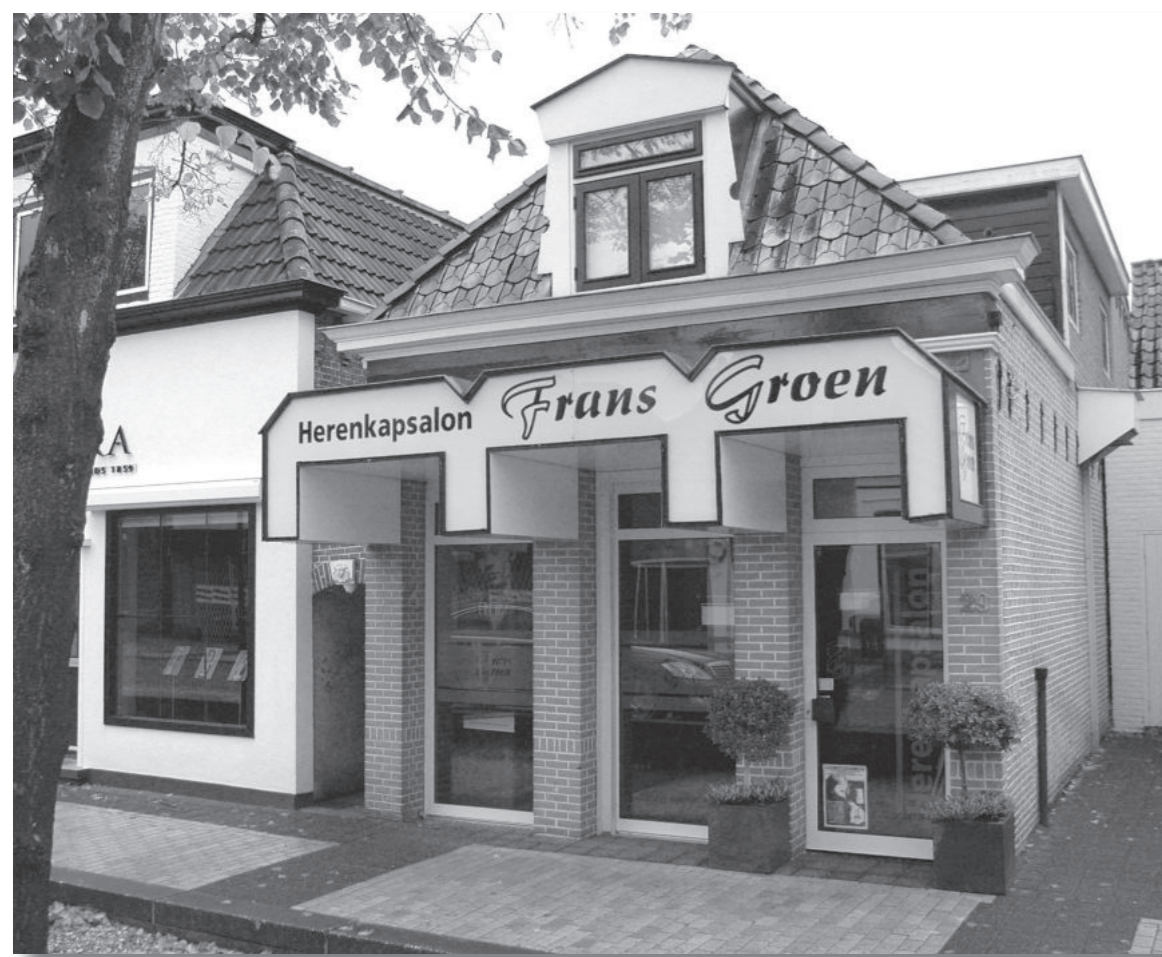
De aanblik van het pand Van Harenstraat 29 in oktober 2007.