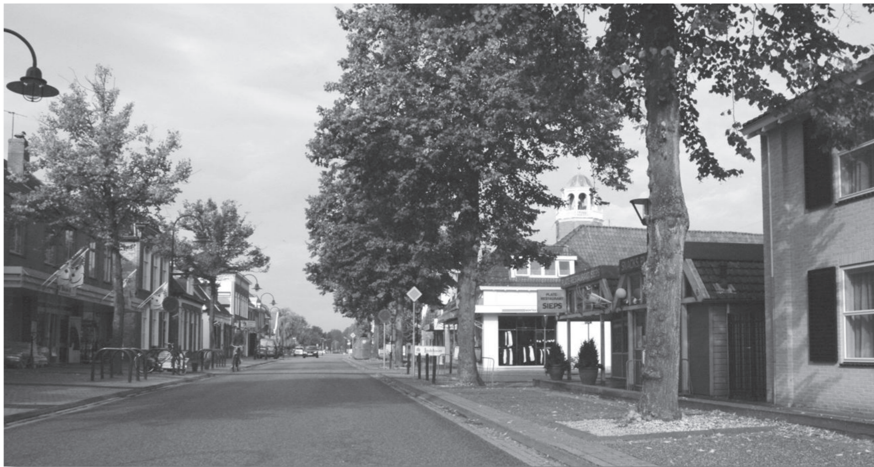
Van Harenstraat 15 hoort in augustus 2007 tot het bedrijf van Platerestaurant Siep's