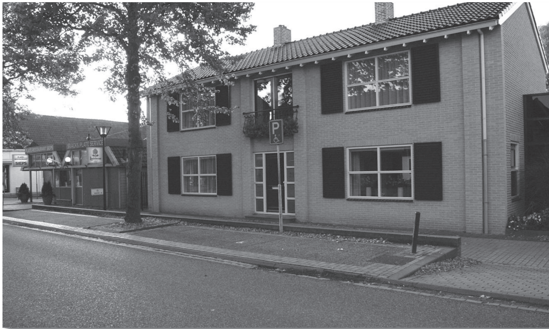
De verbouwde drie onder een kap (2007).