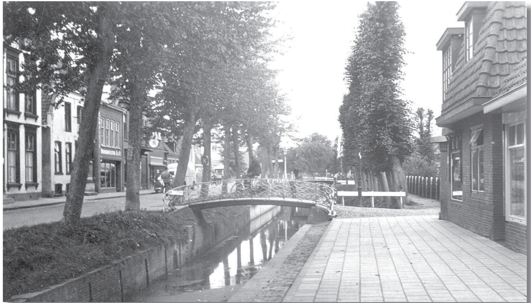
Na de afbraak van het gemeentehuis wordt de Smalle Kant breder (± 1949).