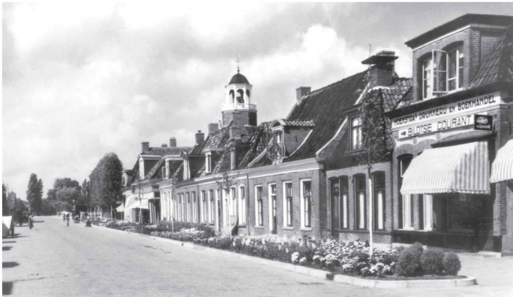
Tel de kajuiten! Het vierde pand van rechts is de voormalige bewaarschool. Rechts daarvan het brede huis. Op de plek van deze twee huizen verrees in 1957 het blok met drie dienstwoningen van drukkerij Hoekstra (± 1952)

In 1876 werd naar aanleiding van 'het Nut' in de gemeenteraadsvergadering het plan geopperd om een nieuwe school op Davelaer te stichten en de "vrijkomende te bestemmen voor de bewaarschool." De toestand in het bewaarschooltje aan de Smalle Kant was zorgwekkend, maar de bouw van een nieuwe school aan de Noorderweg liet nog op zich wachten. De gemeente verkocht het schoolpand aan de Smalle Kant. De bewaarschool werd tijdelijk ondergebracht in Rehoboth, een pand