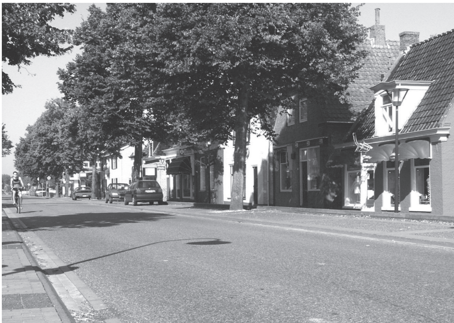
Van Harenstraat - noordzijde, augustus 2007