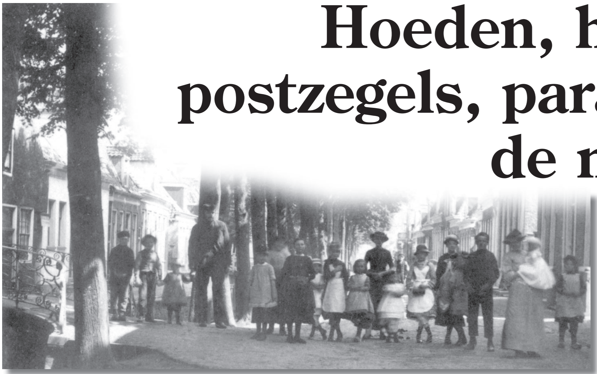
De foto is in het dorp: "Even kijken naar het vogeltje", maar wij richten onze ogen op het huis uiterst links op de foto, waar later de muziektent van korps Excelsior stond.