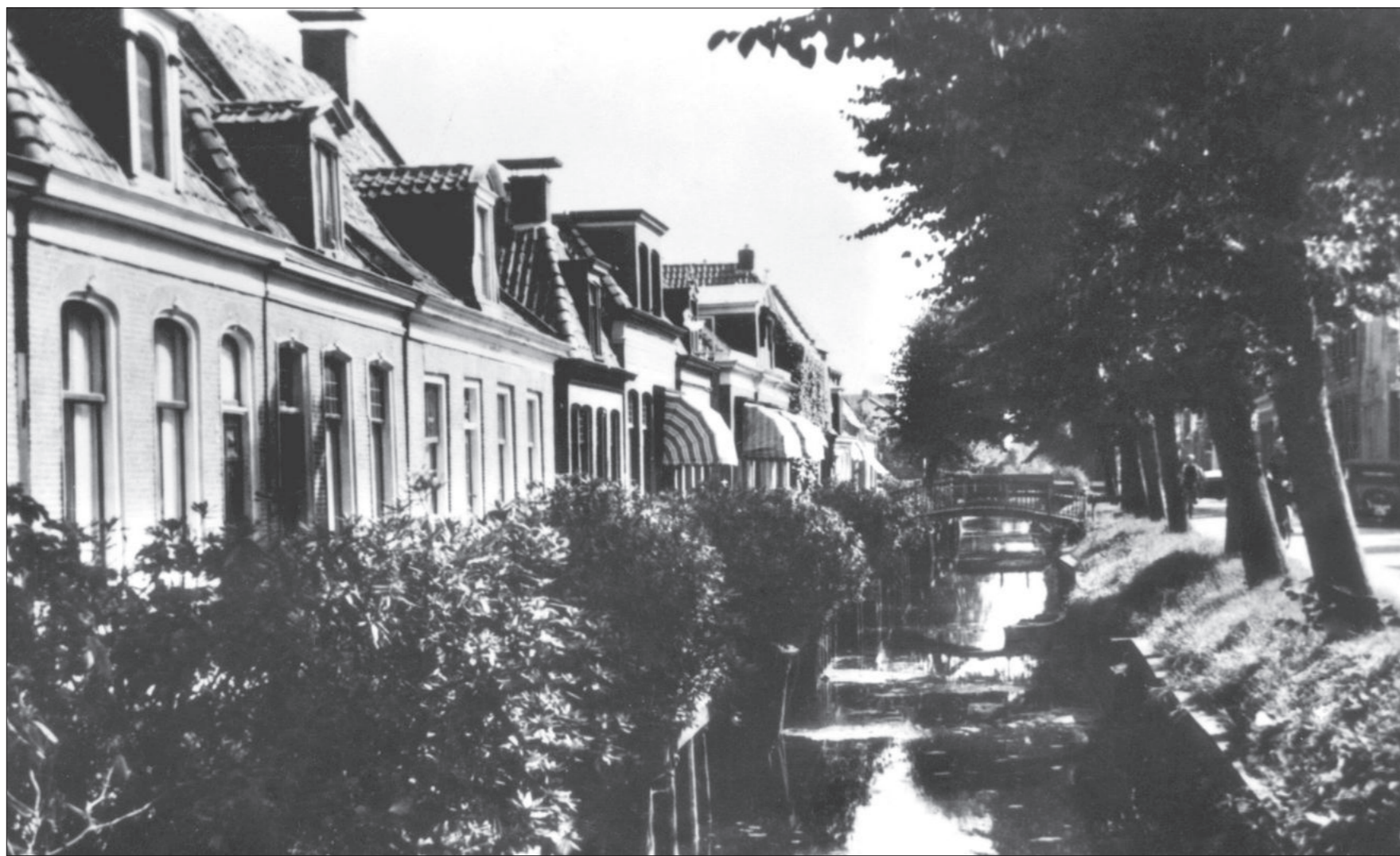
Het tweede pand van links is het voormalige commiezenhuis.