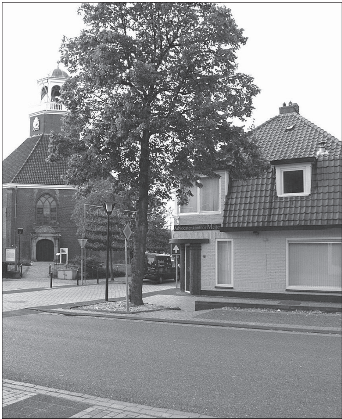
Pand advocatenkantoor Meijer, augustus 2007