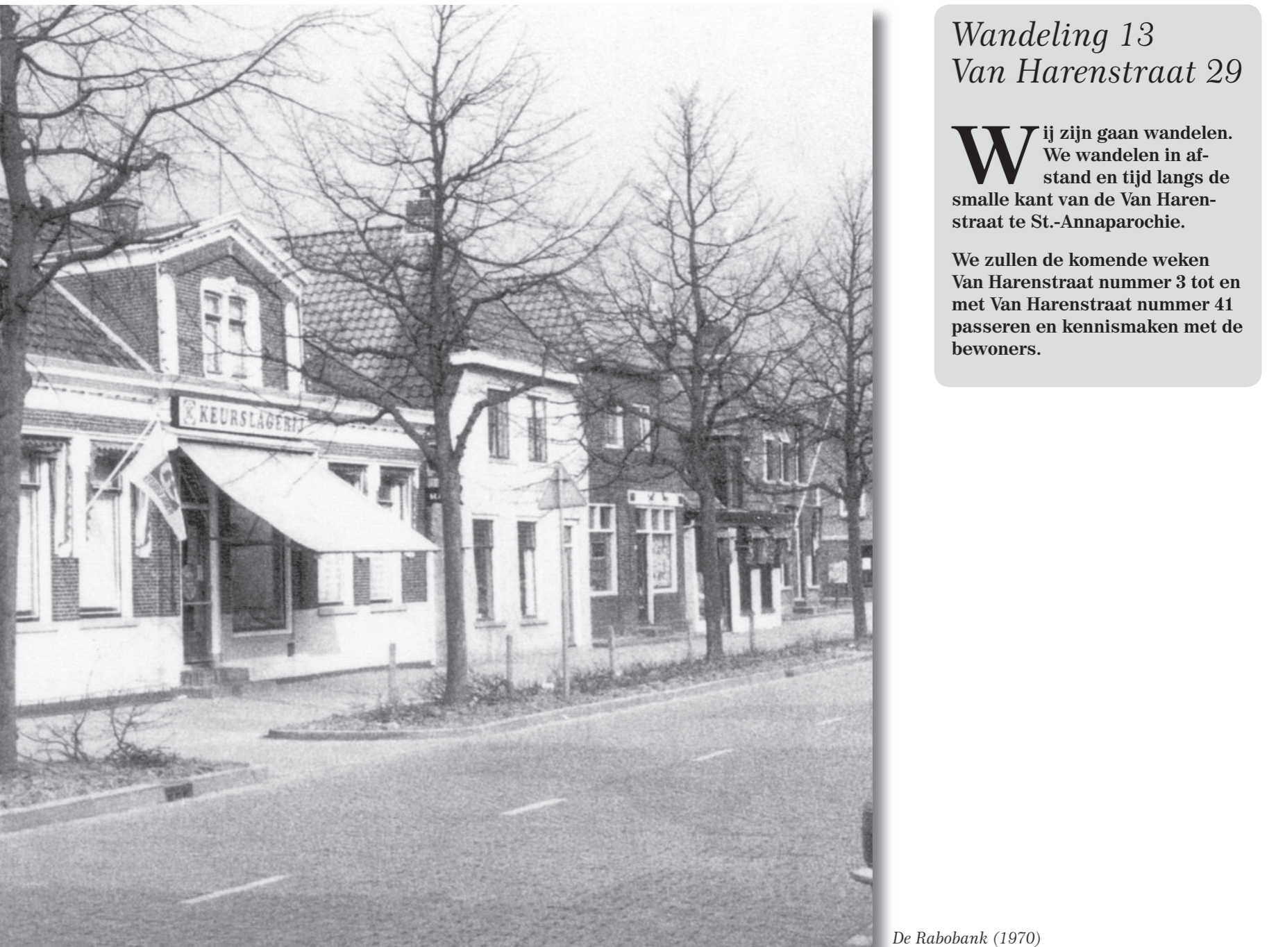
De Rabobank (1970)