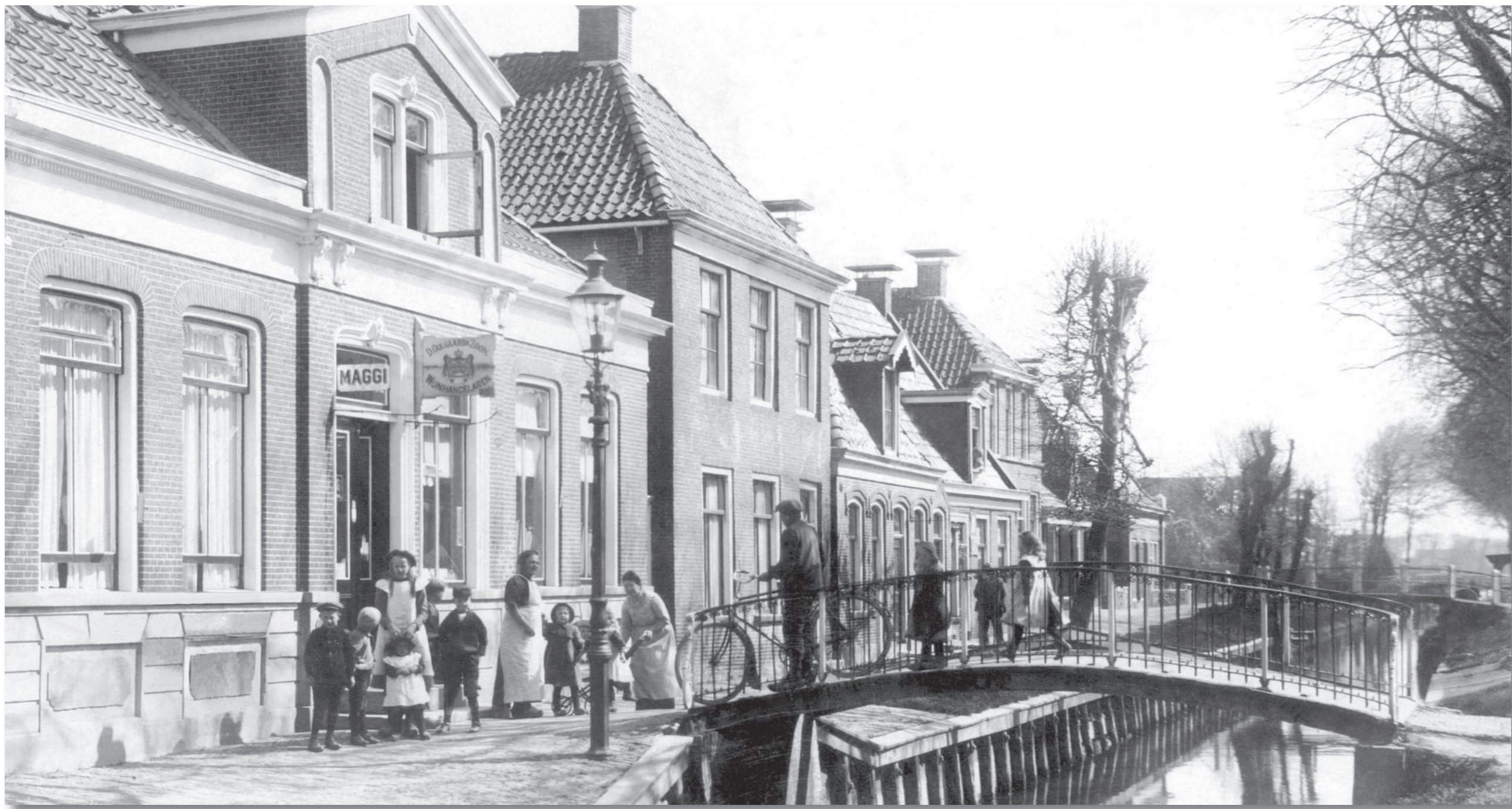
Het tweede pand van links doet nog denken aan een pakhuis (± 1915).