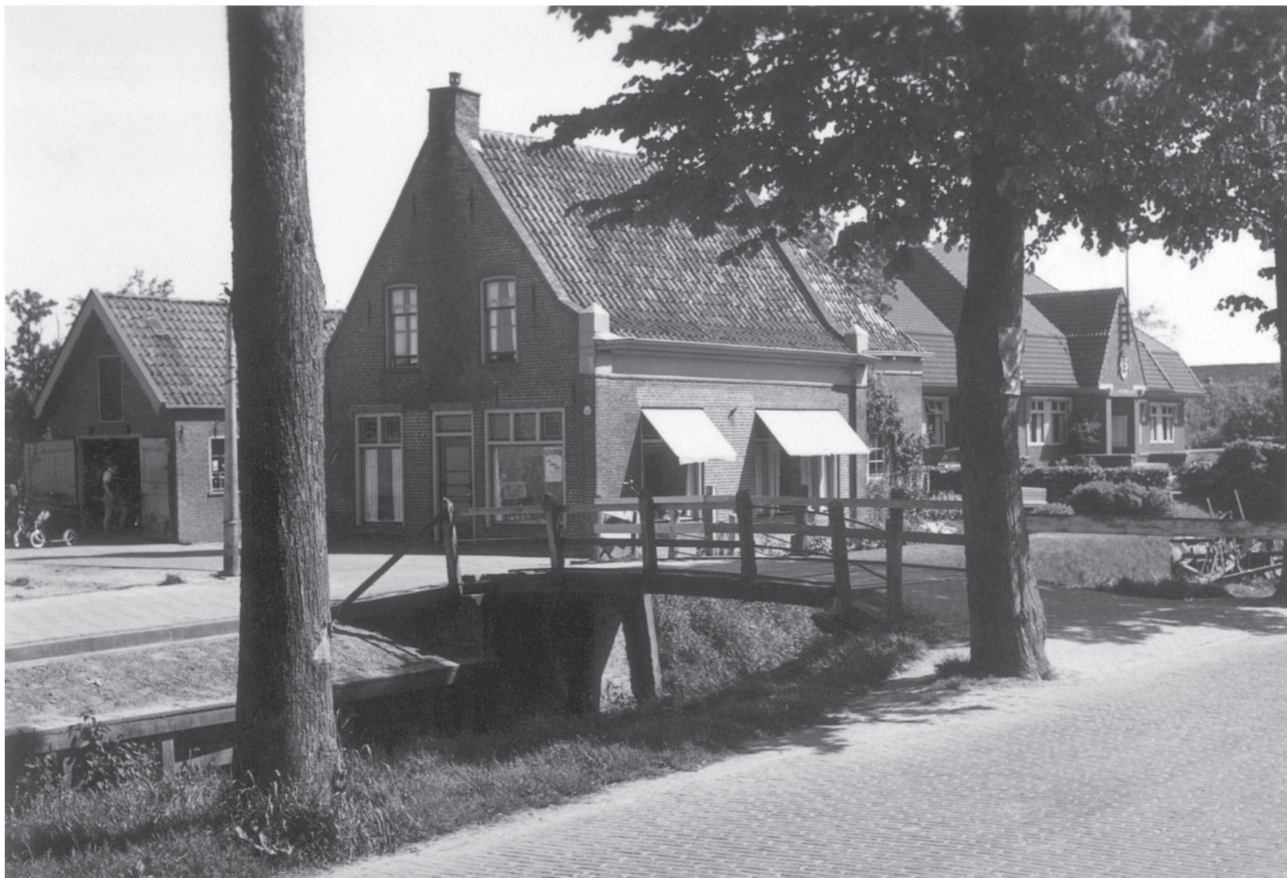
De Molenbrug, met helemaal links de plek waar tot 1940 de wagenmakerij van De Boer stond (± 1949).