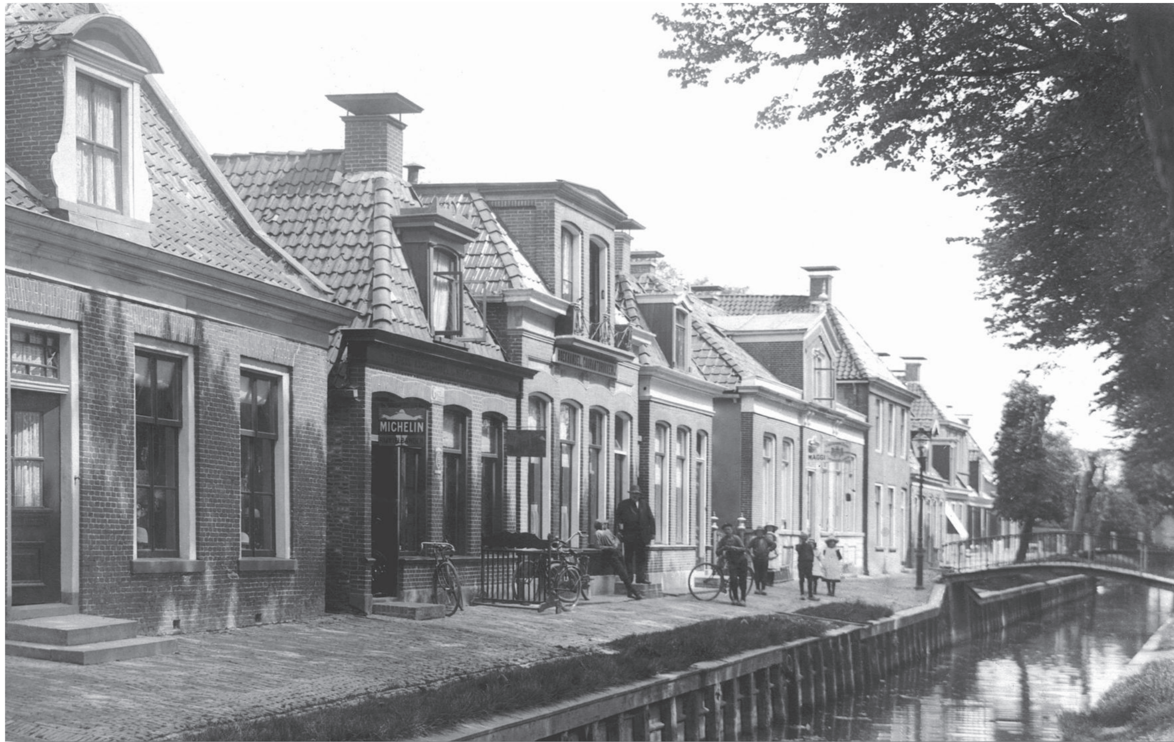
Links zien we de oostelijke helft van het brede huis, de hoedwinkel van de dames Mebius. Het tweede pand van links herbergt de rijwielhandel van Oreel, waar nu het tuintje ligt (± 1914).

Andringa de Kempenaar een geval van diefstal dat tijdens de verhuizing had plaatsgevonden. Uit een gesloten kistje werden ontvreemd "een gouden Engelsch twee kast horologie met porceleinen plaat, gemerkt Potter-London hebbende de binnenkast