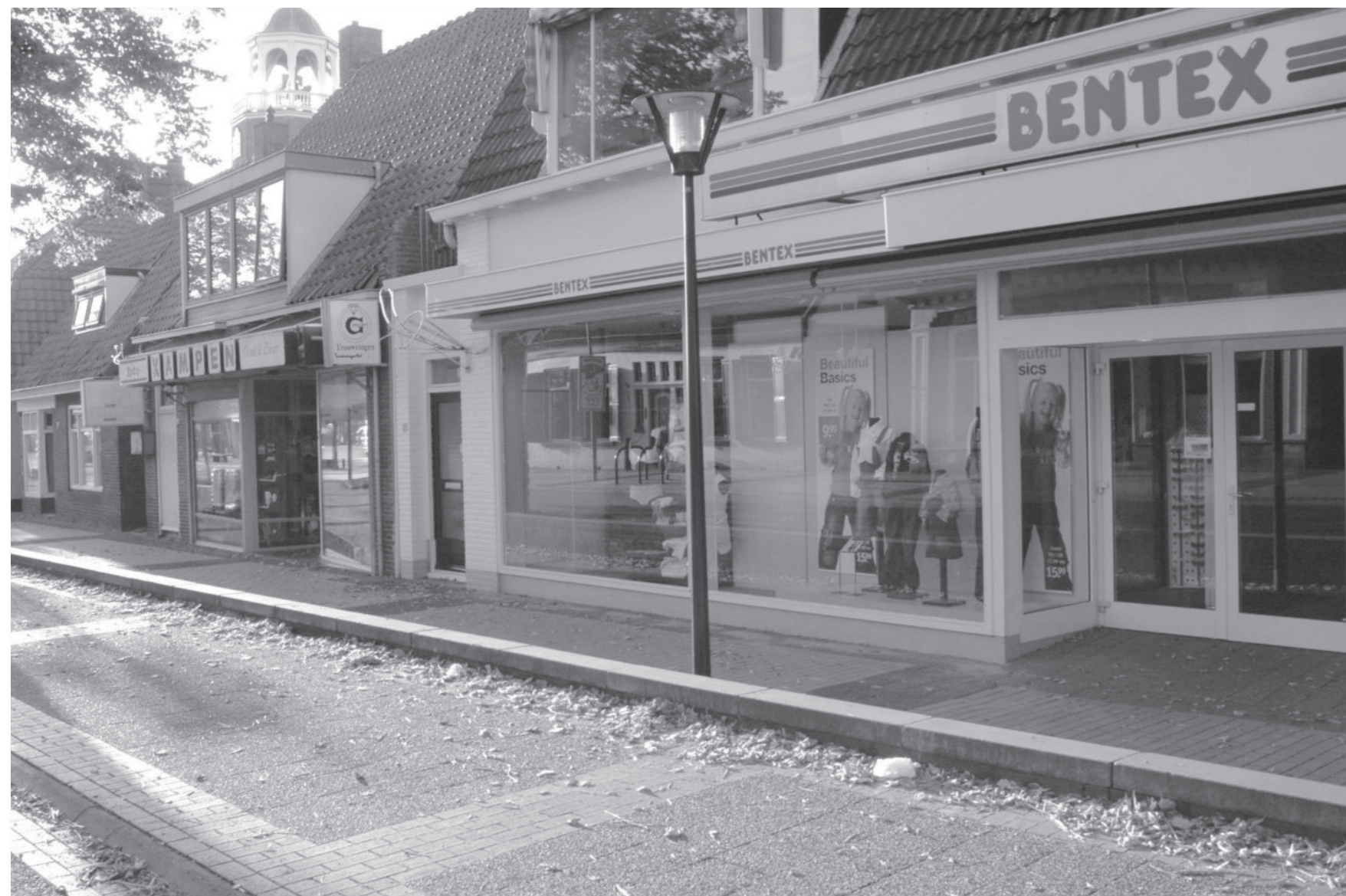
Situatie in augustus 2007